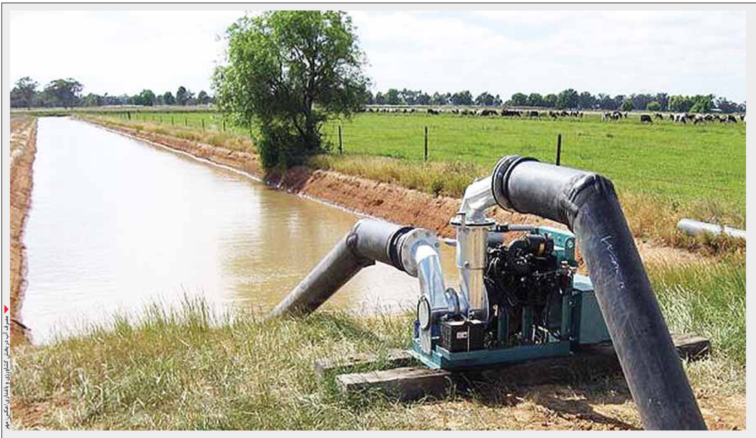
مصرف آب در بخش کشاورزی و کشاورزانش

با خشکسالی و کمبود آب موجود در بخش کشاورزی و باغداری باید تغییر کند زیرا الگوی کشت فعلی و نوع آبیاری موجب تلف شدن آب استان و ایجاد بحران می‌شود.