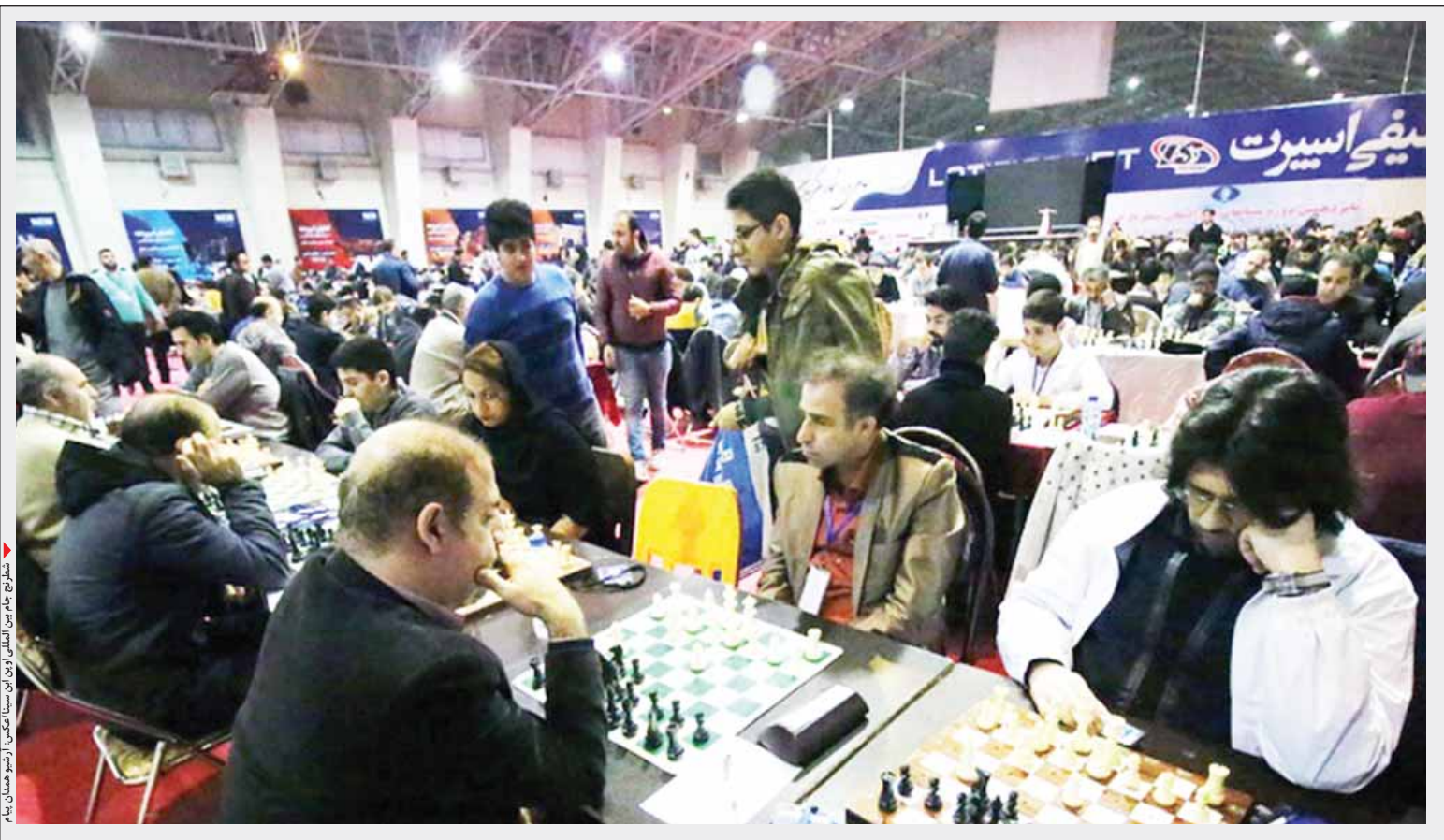
شطرنج در سالن ورزشی همدان

این جام حالا به یکی از رویدادهای معتبر کشورهای تبدیل شده و نگاه فدراسیون‌نشینان به این مسابقات، خارج از نوبت و ویژه‌تر از هر زمانی است. نکته مهم اینکه هیأت شطرنج همدان سال‌های گذشته برای حضور شطرنج‌بازان مطرح خارجی سر کبسه را شل می‌کرد و در ازای حضورشان در این رویداد، پول هنگفتی به حسابشان واریز می‌کرد. موضوعی که از حق نگذریم، کار بزرگ هیأت در ادوار قبلی بود و امسال هم این‌رویه ادامه خواهد داشت. برای مثال در سال ۹۶ هیأت شطرنج استان همدان مبلغ دو هزار و ۵۰۰ دلار به الکسی شنیروف، استاد بزرگ لتونیایی‌الاصل اسپانیا که اتفاقاً قهرمان جام این‌سینا هم شد، پرداخت کرد و همان موقع گیلانی‌ها، به کارپوف قهرمان چندین دوره جهان مبلغی حدود ۴۰ میلیون تومان پرداخت کردند تا با حضور خود در جام خزر، وزن مسابقات را بالاتر ببرد. شاید خیلی‌ها به این موضوع معترض باشند اما نباید فراموش کنیم که همان سال‌ها ثمره میزبانی همدان از