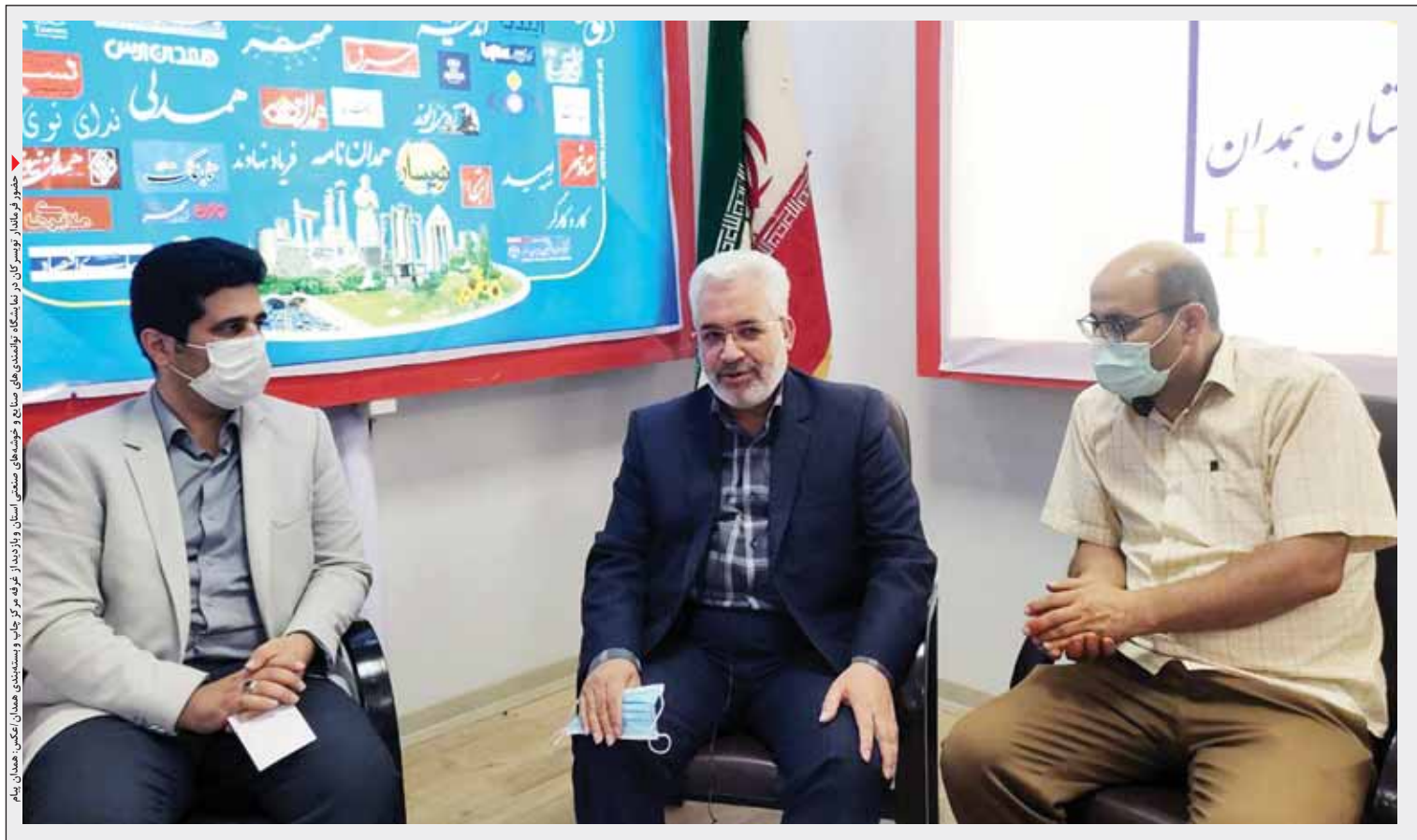
فرماندار توپسر کان در جلسه ستاد بازآفرینی شهری در ملایر