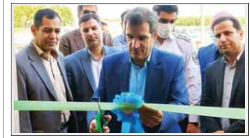
فرماندار توپسر کان در جلسه ستاد بازآفرینی شهری در ملایر

این مرکز در ۲۵ طبقه و زیربنای ۸۷۰ متر مربع احداث می‌شود. جلسه بررسی و رفع مشکلات توزیع آب نهر شعیبان با حضور احمدوند فرماندار نهاوند، بهرام‌لوری رئیس سازمان جهاد کشاورزی، مدیر بحران استانداری، و مسئولین استانی و شهرستانی امور آب و جهاد کشاورزی برگزار شد.