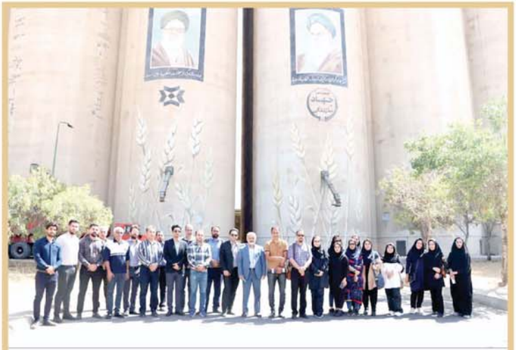
مدیرکل غله و خدمات بازرگانی استان خبر داد

رئیس کل بانک مرکزی گفت: آزادسازی منابع ارزی ایران در کره جنوبی به حساب بانک مرکزی سوئیس برای تأمین به یورو منتقل می‌شود. وی در ادامه گفت: بانک ایران در ۱۰۰ میلیارد دلار فدرال رزرو آمریکا در اختیار دارد که به واسطه آن می‌تواند به تعیبات منابع ارزی ایران در آن آزاد کند.