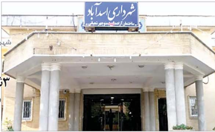
شهردار اسداباد استعفا داد