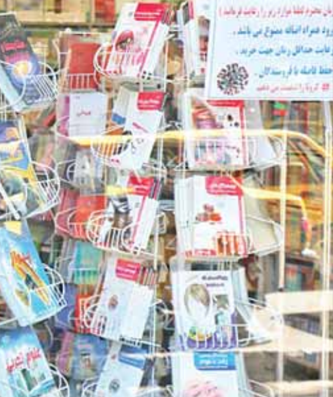
این طرح دیر به ما اطلاع‌رسانی شد

شیوع کرونا به‌رغم اینکه برای کتابفروشی‌ها و صنعت نشر ضرر و زیان به همراه داشت اما فرصتی مناسب بود تا سراسرانه مطالعاتی کشور افزایش پیدا کند. طبق آخرین آمار منتشر شده نیمی از ایرانیان به‌طور متوسط هفته‌ای ۳۷ ساعت مطالعه می‌کنند؛ با شیوع کرونا و خانه‌نشینی مردم که تفریحات خارج از خانه آنها تقریباً به صفر رسید و از طرفی مشغله‌های کاری تا حد زیادی کاهش پیدا کرد فرصت مناسبی بود تا مردم به سمت مطالعه بروند. در روزهای ابتدایی کرونا برای اینکه فروش کتاب همچنان رونق داشته باشد و از طرفی خواندن کتاب یکی از تفریحات پیشنهاد شده برای مردم در روزهای خانه‌نشینی بود طرحی از جانب شهرداری همدان مطرح شد که در این طرح کتابفروشی‌ها با ۲۰ درصد تخفیف و پیک رایگان کتاب‌ها را به مردم بفروشند. این طرح در بازه زمانی ۲۰ اسفندماه تا ۲۳ فروردین‌ماه برقرار بود.