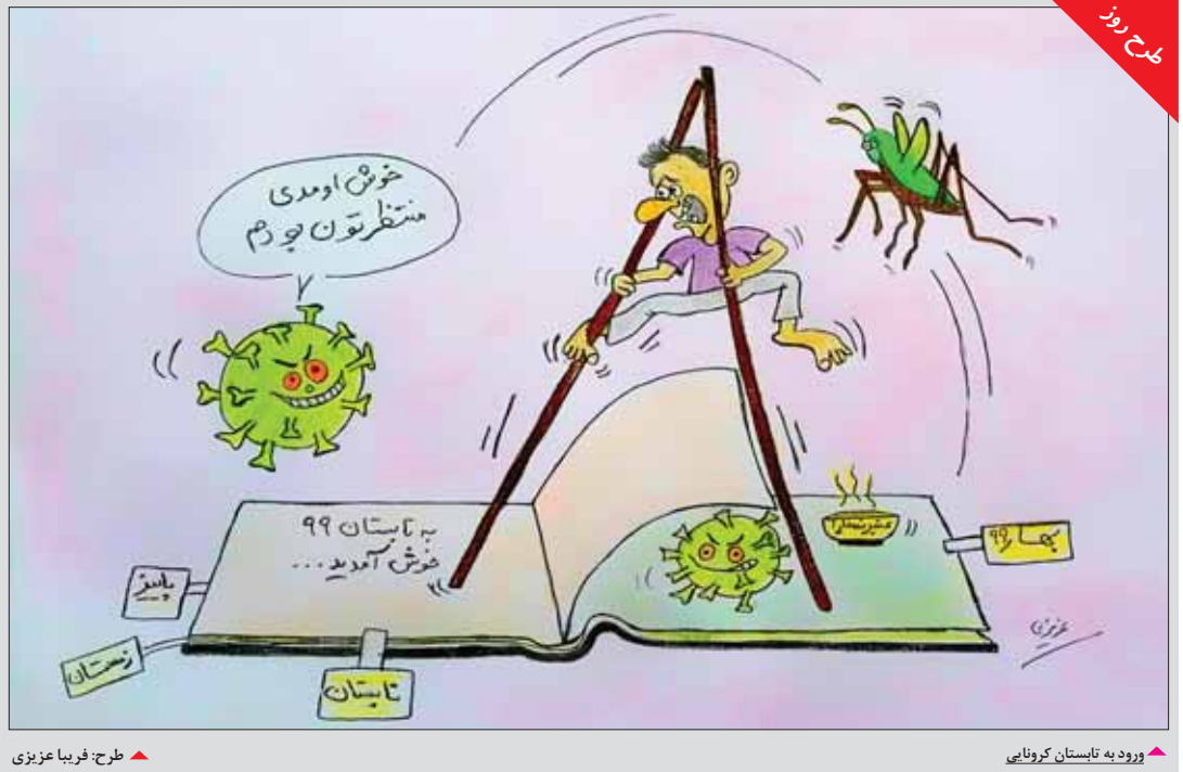
طرح: فریبا عزیز

روزنامه ارسال شده آمده است: در پی مداخلات هفته‌های اخیر در دامنه شمالی الوندکوه به اطلاع می‌رساند این تنش حاصل چالش بزرگی است که از سال‌ها پیش در دامنه الوند شکل گرفته و امروز این زخم چرکین دهان گشوده است این اتفاق حاصل پدیده تخریب محیط زیست و به‌تازگی پدیده کوه‌خواری است که لطعات شدیدی را برای باقیمانده سبزینه‌های شهر فراهم کرده است. وی افزود تا باقیمانده این پوشش که روزگاری از دور چگون دریاچه‌ای می‌نمود و امروز چون