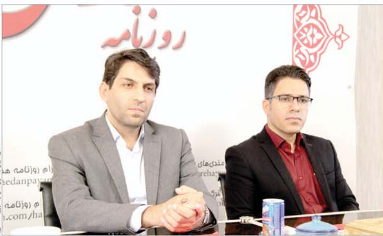
مدیرکل ثبت احوال استان با حضور در همدان پیام:

وی هدف از راه اندازی سامانه سپیم و ارائه هر چه بهتر خدمات بیشتر به اطلاعات خانواده توسط دستگه‌های اجرایی آن بوده و افزود: پایگاهی با منسولیت سازمان ثبت احوال کشور که در آن اطلاعات سنی و نسبی شهروندان ایرانی شامل اطلاعات بدنی، مسو و فرزندان ثبت شده و سایر ارائه خدمات به خانواده‌های ایرانی خواهد بود.