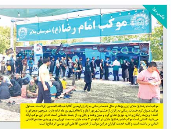
موبک نامم رضا (ع) در روزها در حال خدمت رسانی به زائران زمین آقا علیه السلام الحسین (ع) است.

معاون گردشگری وزارت میراث فرهنگی، صنایع دستی و گردشگری گفت: لغو یکطرفه روایتد استقبال اتعاج خارجی از گردشگری سلامت را مصلحتی نیست.