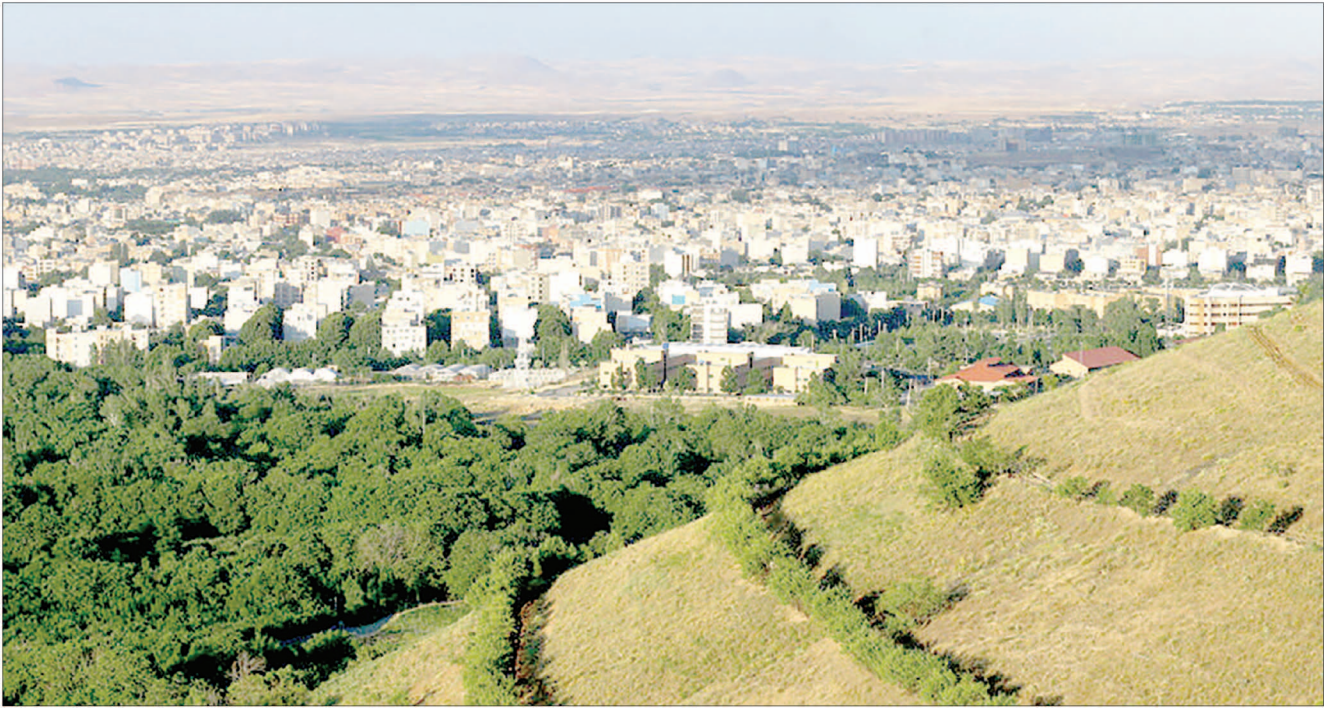
تصویر ترابری استا | علی اصفا

تاکنون ساخت وساز در این منطقه قانونی نبوده ولی با ساخت ساختمان‌های یک طبقه در شورای عالی شهرسازی و معماری تا ۴طبقه یک اشفتگی در کوهپایه الوند ایجاد شده است و با قانونی‌شدن، علاوه بر اینکه مالکان جدید به سودهای چندین برابری دست می‌یابند ساخت وسازهای لاکچری رونق خواهدگرفت و مجدداً گردش مالی بالایی ایجاد خواهدکرد.