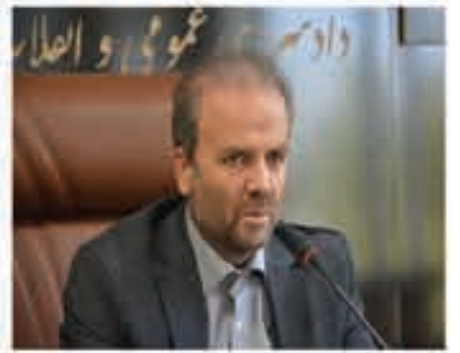
مهر - دادستان عمومی و انقلاب استان کرمانشاه از ارسال پرونده متهمان بیمارستان اسلام آباد غرب به دادگاه کیفری خبر داد.

به نقل از روابط عمومی دادستانی استان کرمانشاه، پرونده اتهامی مدیران عامل شرکت‌های ساختمانی دخیل در احداث نمای بیمارستان حضرت امام خمینی (ره) اسلام آباد غرب با عنوان تقلب در ساخت بنا متهم به ورود خسارت به بینامتنال موضوع ماده ۵۹۹ قانون مجازات اسلامی پس از تکمیل تحقیقات واحد نظریات محابتهای کارشناسی با صدور کیفرخواست برای رسیدگی و محاکمه به دادگاه کیفری ارسال شد.