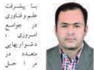
یا پیشرفت علم و فناوری در جوامع امروز، دشواریهای متعدد در مراحل مختلف

قبل از فوت والدین تقسیم ارثیه در قالب ماترک معنی ندارد و فقط می‌توانند در قالب یکی از عقود، اموال را به نام فرزندان خود یا اشخاص دیگر منتقل نمایند