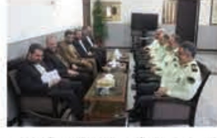
اثرنا - رئیس کل دادگستری استان کرمانشاه گفت: پلیس ولایتی و انقلابی جمهوری اسلامی با تلاش های شبانه روزی مأموریت امنیت کم نظیر و مثال زنی را در کشور ایجاد کرده که جای قدردانی دارد.

احمدرضا خاندانخواه روز یکشنبه در دیدار مسئولان قضایی استان با فرمانده انتظامی استان کرمانشاه با بیان اینکه تلاش‌ها و زحمات پلیس سر هیچکس پوشیده نیست، افزود: رعایت رهبر معظم انقلاب از مجموعه خدمات و فعالیت‌های کارکنان انتظامی بیانگر این است که آنها راه خود را درست می‌دانند. وی با بیان اینکه تصور یک روز جامعه بدون حضور پلیس سخت و عملاً غیرممکن است، گفت: نقش پلیس در نظم و انضباط اجتماعی به قدری است که حتی مخالفت هم می‌تواند آن را رها کند.