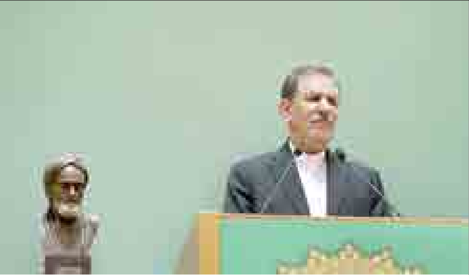
وزیر امور خارجه