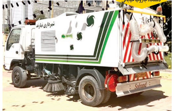
دستگاه جاروب خیابانی

➡ اضافه شدن یک دستگاه خودرو آتش نشانی به ارزش ریالی حدود ۴۰/۰۰۰/۰۰۰/۰۰۰ ریال