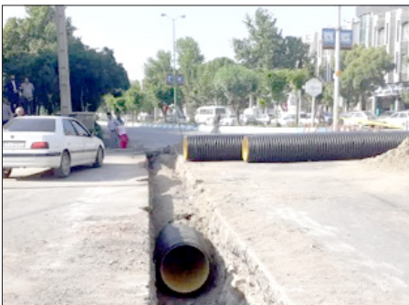
لوله گذاری بیش از ۱۵ معبر به مقدار ۵۰۰ متر