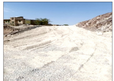
ورودی معبر دوخواهران