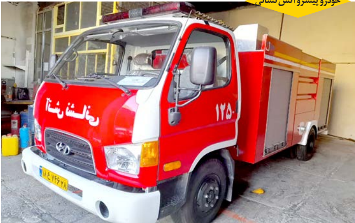
خودرو پیشرو آتش نشانی

➡ اضافه شدن یک دستگاه خودرو آتش نشانی به ارزش ریالی حدود ۴۰/۰۰۰/۰۰۰/۰۰۰ ریال