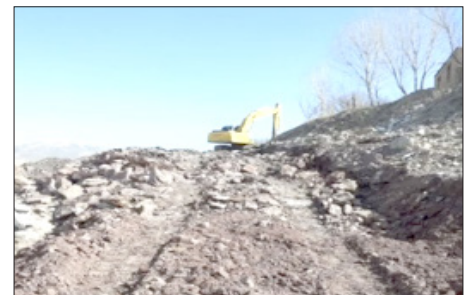
محور دوخواهران بلوار امام حسین (ع) به طول یک کیلومتر