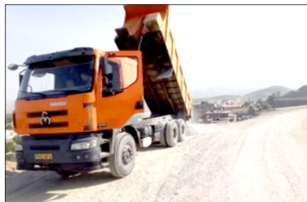
معبر بیست متری بلوار امام حسین (ع) به محله شیخ منصور ۶۰۰ متر