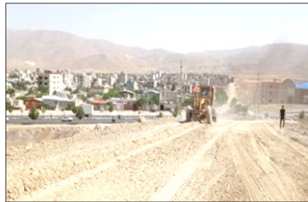
بیس ریزی ۴۵۰ معبر به مساحت ۱۰۰ هزار متر مربع