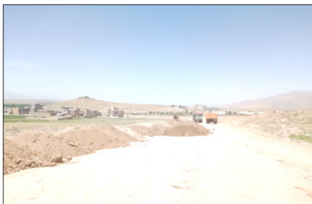
معبر دوخواهران به شهرک فارابی