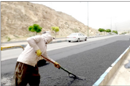
آسفالت بیش از ۴۰۰ معبر شهری به مقدار ۱۶۱۳ هزار متر مربع