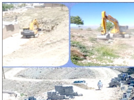
معبر فرعی محله پای قلعه ۱۰۰۰ متر