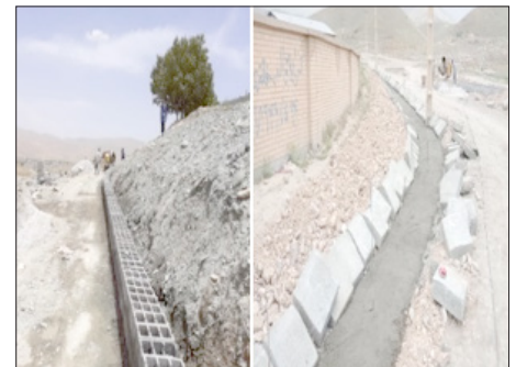
جمع آوری آبهای سطحی و جدول کشی و بلوک گذاری بیش از ۱۵۰ معبر به مساحت ۱۸ هزار متر مربع