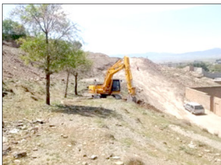
دوخواهران به بلوار امام حسین