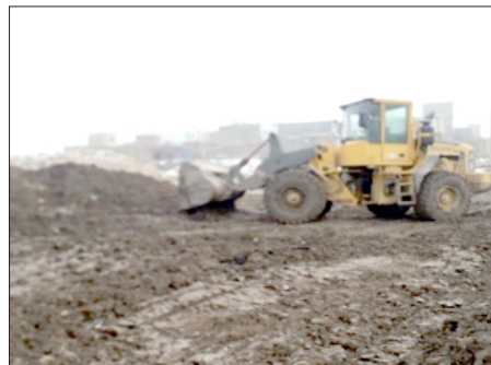
بازگشایی معابر، بیش از ۵۰ معبر به مساحت ۴۹,۲۰۰ متر مربع