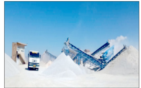
کارخانه آسفالت و تولید شن و تولید ۱۸ هزار تن آسفالت