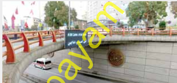
ایمن سازی کمر بندی