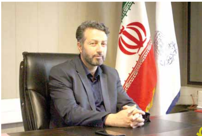
مدیر شهرداری منطقه ۴ خبر داد