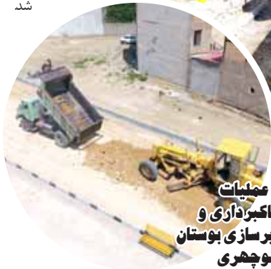
عملیات خاکبرداری و زیرسازی بوستان منوچهری

از خواسته‌ها و گلایه‌های مردم است با بیان اینکه از آغاز سال ۹۸ تاکنون حدود ۱۰ هزار تن پخش آسفالت در سطح معابر منطقه ۴ شهر همدان صورت گرفته است، اظهار کرد: از جمله این مسیرها می‌توان به تراش و روکش آسفالت کوی ولیعصر (عج) به تناژ ۱۴۷۸، حصار مطهری و کوی رضوان به تناژ ۱۱۴، اسلامشهر به تناژ ۵۹۲، حصار امام خمینی (ره) و حصار علی‌آباد به تناژ ۴۳۵، جانبازان و باباطاهر به تناژ ۱۸۱۹، منوچهری به تناژ ۵۴۴، شهرک الوند به تناژ ۲۶۴، شهرک فرهنگیان به تناژ ۱۸۱۱، معابر اصلی به تناژ ۲۷۰۰ اشاره کرد.