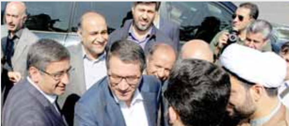
استقبال از وزیر صنعت در بدو ورود به همدان