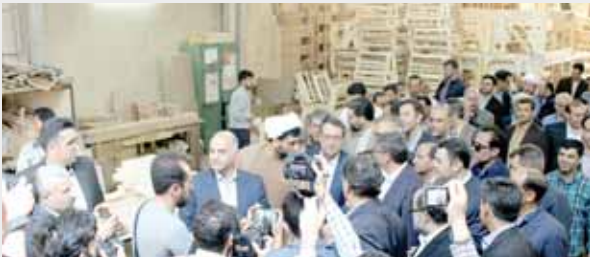
تولیدی مبل ملایر