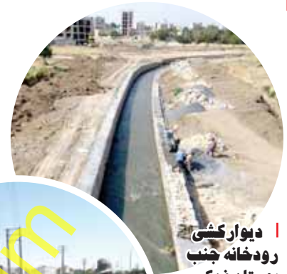
دیوارکشی رودخانه جنب بوستان فدک