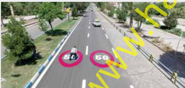
سه شنبه های بدون خودرو