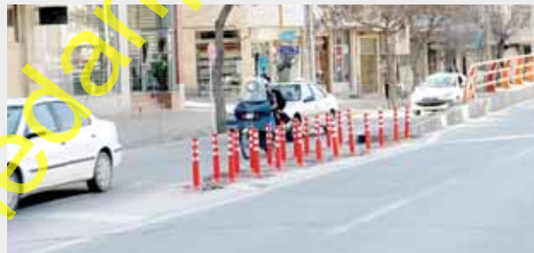
بهسازی علائم ترافیکی (سیلندر، تابلو، چراغ)