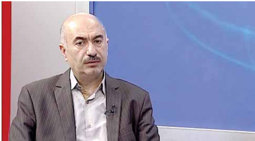
رئیس سازمان صنعت، معدن و تجارت خبر داد