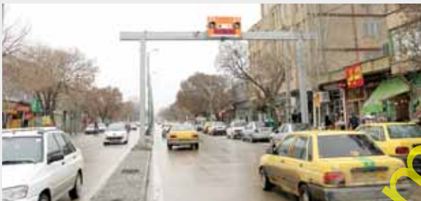
نصب دوربین های محدوده کنترل ترافیک