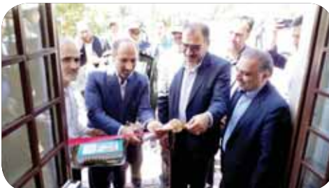
افتتاح ساختمان آفتاب نشانی شهرک صنعتی تویرکان

بادامی در ادامه از ایجاد ناحیه صنعتی قروه درگزین در شهرستان تازه تأسیس درگزین خبر داد و اظهار کرد: مساحت زمین این ناحیه صنعتی ۵۰ هکتار است که بیش از نیمی از آن تملک شده است.