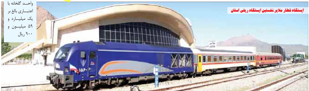
ایستگاه قطار ملایر نخستین ایستگاه ریلی استان

ظاهر پورمجاهد با اشاره به مشکلات اقتصادی و معیشتی و ایجاد تنگنانهایی در مسیر حرکت دولت، با بیان اینکه تلاش مسئولان و دولتمردان رفع مشکلات مردم و پاسخگویی به نیاز آنها است، بیان کرد: به واسطه تلاش‌های خوب دولت، امروز صادرات و تجارت خارجی روند مثبتی دارد و با وجود تمامی کارشکنی‌های دشمنان، تراز تجاری