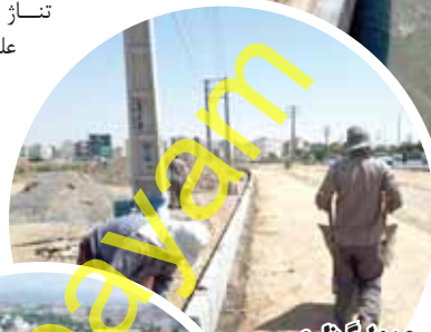
جدول گذاری اصلاح هندسی بلوار آیتا... نجفی لاین غربی