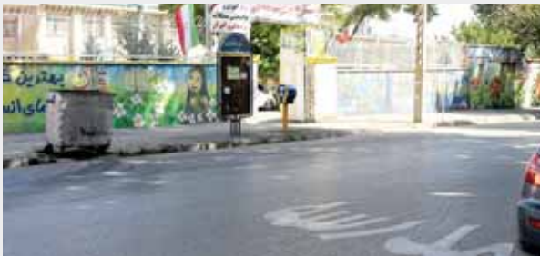
ایمن سازی مدارس