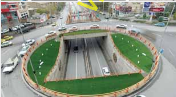
خط کشی ۲ جزیی