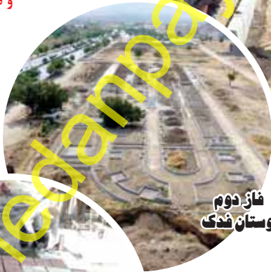
فاز دوم بوستان فدک