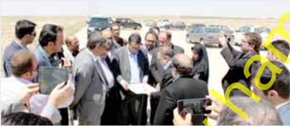
گتنگو با فعالان اقتصادی در اتویان همدان- ساوه