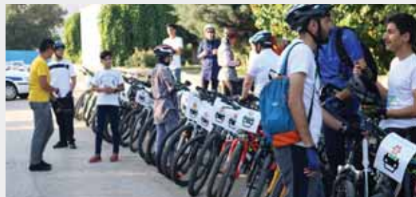
خط کشی محوری