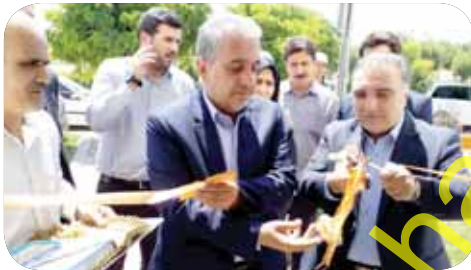
افتتاح ساختمان آفتاب نشانی شهرک صنعتی اسدآباد