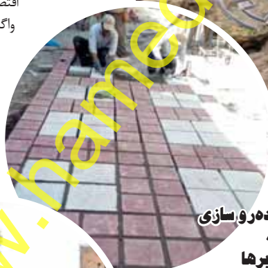
پایه دروسازی راسته شیشه برها