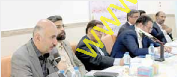
نشست وزیر با فعالان اقتصادی تویسرکان