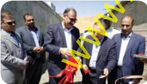
افتتاح مخزن آب شهرک صنعتی تویرکان