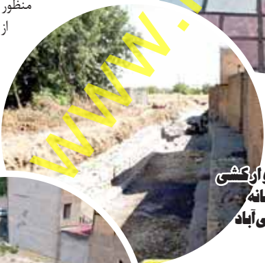
دیوارکشی رودخانه صیفی آباد