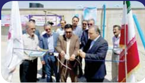
افتتاح مخزن آب زمینی شهرک صنعتی بهاران