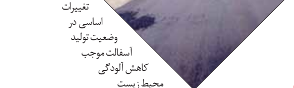
افزایش عمر آسفالت با روش پلیمری