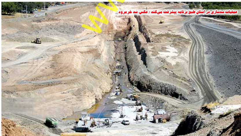
عملیات سدسازی در استان طبق برنامه پیشرفت می‌کند / عکس: سد خرمرود

مدیرعامل شرکت آب منطقه‌ای استان در ادامه به ۴ پروژه مهم