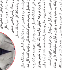
معاونان هماهنگی امور اقتصادی استانداری همدان

نمایشگاه با هدف معرفی فرصتهای سرمایه‌گذاری و جذب سرمایه‌گذاران گردشگری و صنایع دستی همدان در زمینه پتانسیل‌های گردشگری استان اهواز برگزار می‌شود. این نمایشگاه فرصتی است برای معرفی ظرفیتهای گردشگری و صنایع دستی استان اهواز به میزبانان و سرمایه‌گذاران. همچنین فرصتی است برای معرفی ظرفیتهای گردشگری و صنایع دستی استان اهواز به میزبانان و سرمایه‌گذاران.