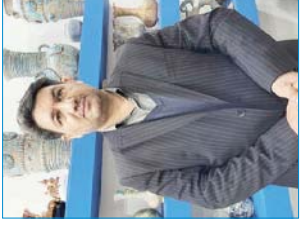
معاونان هماهنگی امور اقتصادی استانداری همدان

معاون گردشگری همدان در شانزدهمین دوره نمایشگاه گردشگری اهواز گفت: «هدف اصلی از برگزاری این نمایشگاه، جذب سرمایه‌گذاران و معرفی ظرفیتهای گردشگری و صنایع دستی استان اهواز است. ما باید ظرفیتهای گردشگری و صنایع دستی استان اهواز را به مردم معرفی کنیم. همچنین باید در زمینه سرمایه‌گذاری و جذب سرمایه‌گذاران در زمینه گردشگری و صنایع دستی استان اهواز اقدامات بیشتری انجام دهیم. ما باید ظرفیتهای گردشگری و صنایع دستی استان اهواز را به مردم معرفی کنیم. همچنین باید در زمینه سرمایه‌گذاری و جذب سرمایه‌گذاران در زمینه گردشگری و صنایع دستی استان اهواز اقدامات بیشتری انجام دهیم.