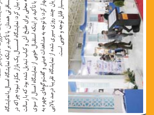
معاونان هماهنگی امور اقتصادی استانداری همدان