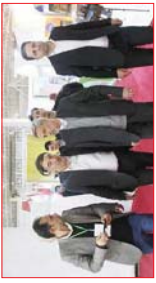
معاونان هماهنگی امور اقتصادی استانداری همدان

صنایع مجوزهای سر ماهیه گذاری در گردشگری می تسهیل می شود. مدیران و رؤسای سازمان گردشگری اهواز باز کرده