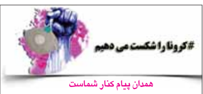
# کرونا را نکست می دهیم همدان پیام کنار شماست