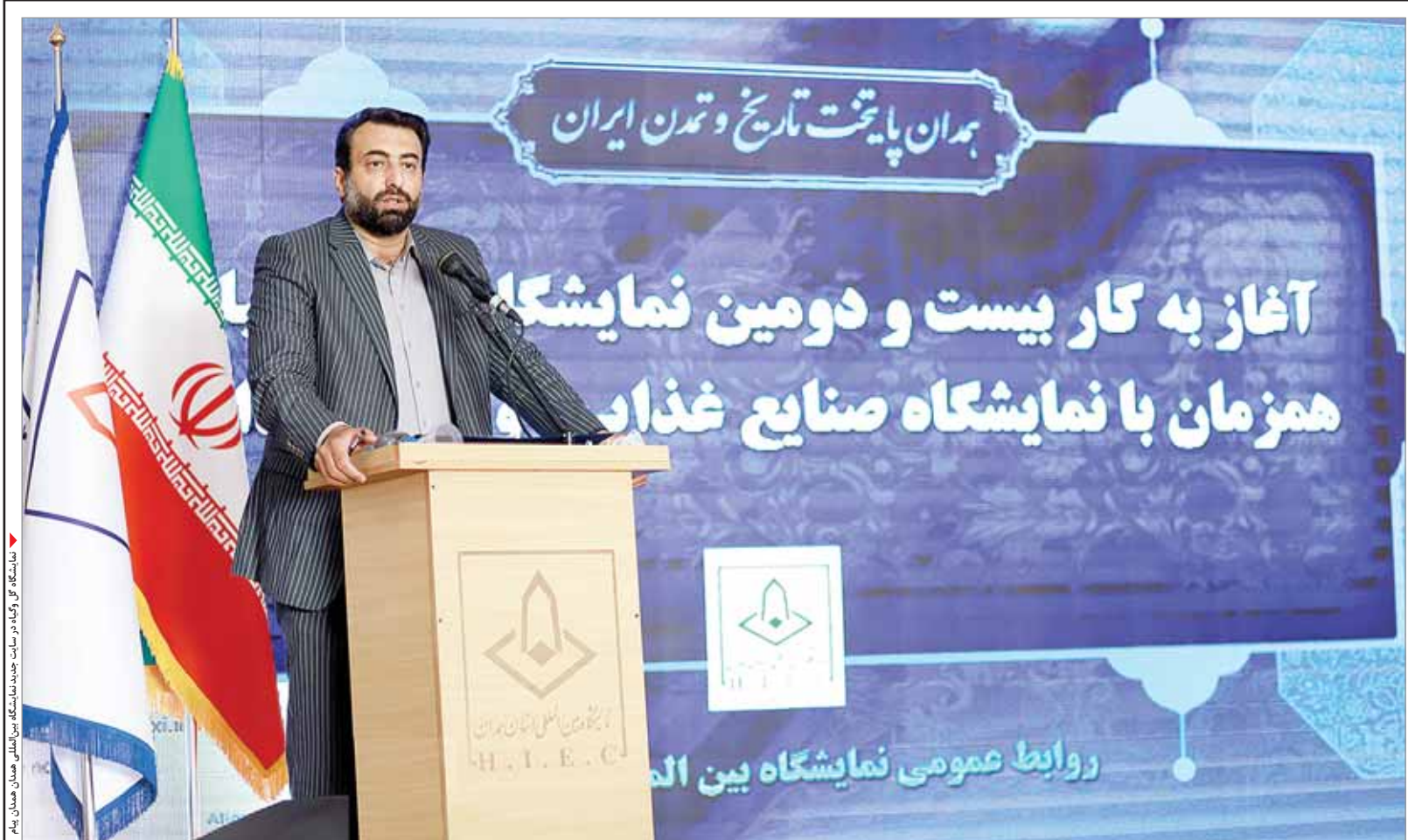
نمایشگاه گل و گیاه در سایت جدید نمایشگاه بین‌المللی همدان پیام