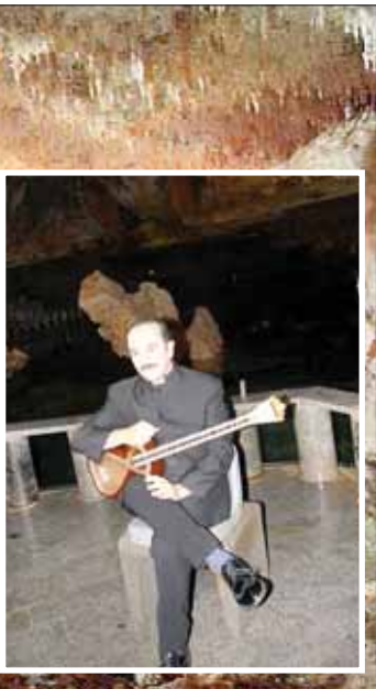
جدید را تمرین کرد که خود این هم برای گروه زمان‌بر است.

پاکروان انعکاس زیبایی موسیقی در غار علیصدر را اتفاقی متمایز در حوزه موسیقی برای گروه توصیف کرد و گفت: از تماشاگر حسنی که دارد، این است که عده محدودی شما را می‌بینند و شما می‌توانید این اجرا را در شهرها و کشورهای مختلف تکرار کنید و یک برنامه موسیقی که تمرین می‌شود بارها قابل اجرا است چون شنوندگان آن متفاوت هستند اما در یک اجرای آنلاین تعداد زیادی از مخاطبان در شهرهای مختلف کنسرت را می‌بینند و این کار را دشوار می‌کند و باید در هر اجرا یک قطعه