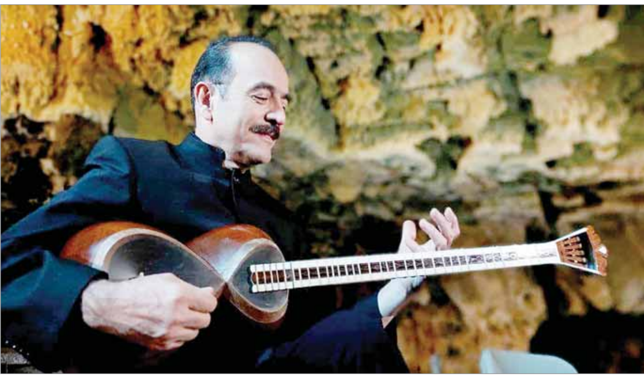
گردشگری باموسیقی در غار علیصدر نفس تازه کرد

اجرای استاد کیوان ساکت با گروه بانوان وزیری از علیصدر کلید خورد