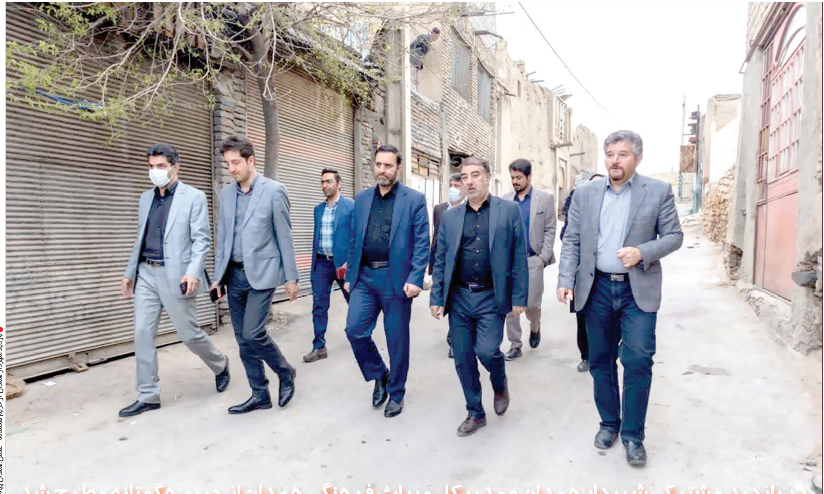
بازدید مشترک شهردار همدان و مدیرکل میراث فرهنگی همدان از حریم هگمتانه بطرح شد

میرسد، اشاره کرد و گفت: در حال حاضر در کنار شورای سیاست‌گذاری ثبت جهانی استان همدان، کمیته اجرایی مصوبات و تصمیمات این شورا هم تشکیل و بر اجرا مصوبات اهتمام جدی ورزیده میشود. مدیرکل میراث فرهنگی، گردشگری و صنایع دستی استان همدان هم‌زمان با مدیرکل میراث فرهنگی، گردشگری و صنایع دستی استان همدان در بازدیدی مشترک به همراه هیأت مدیره میراث فرهنگی، گردشگری و صنایع دستی استان همدان، حذب سواره از محدوده هگمتانه، کف سازی و جداره سازی ها و کوچه های و مسیرهای اطراف و در حریم هگمتانه دانست.