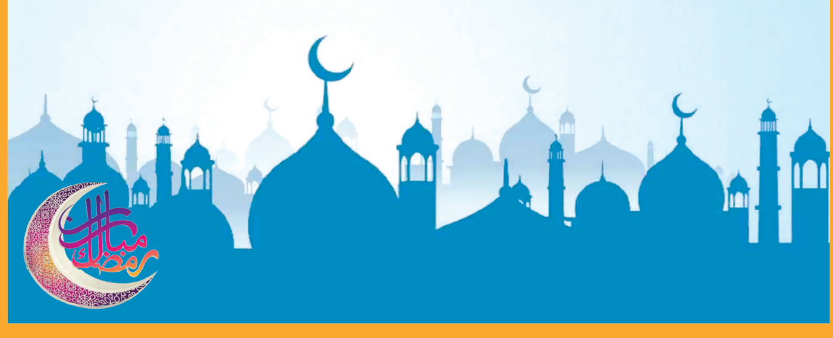
تولید: محسن در صورت تغییر در روز اول ماه قمری، اوقات شرعی مکانی برای روزهای شمسی و میلادی معتبر است