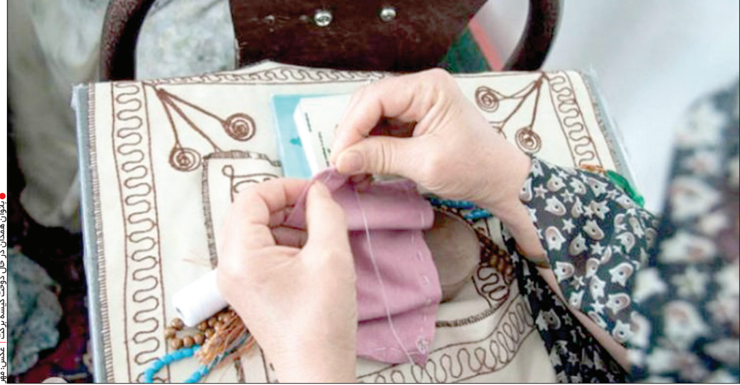
تولید همدان، طرح دوخت کیسه‌برکت