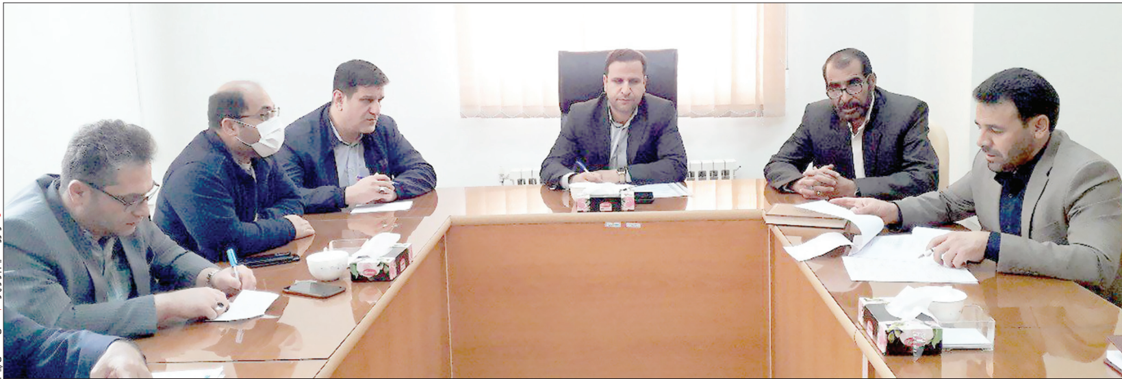
کارگروه تنظیم بازار همدان

نهانوند کمالوند خبرنگار همدان پیام: پس از حدود دو ماه دریافت کرایه اضافه و افزایش خودسرانه کرایه ها هم درون شهری و هم روستایی، حالا متولیان در جلسه اقدام مشترک افزایش هر گونه کرایه را تا پیش از اردیبهشت ماه ممنوع اعلام کرده اند! یک هفته به آغاز اردیبهشت مانده و درست نوشدارویی که پس از اعمال به قول مسولان خودسرانه کرایه ها در اوج تردهای پر حجم پیش از نوروز و ابتدای سال، تجویز و یقینا دیگر فرقی اتفاقی به حال مردم نخواهد داشت.