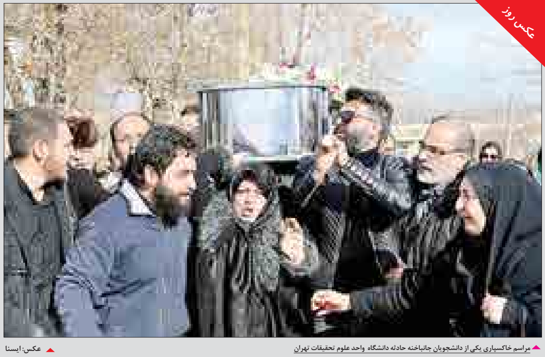
مراسم خاکسپاری یکی از دانشجویان جانباخته حادثه دانشگاه واحد علوم تحقیقات تهران

در کمیته آثار ملی منقول ۴۵ اثر از ۵ استان‌های زنجان، آذربایجان غربی، لرستان، یزد و سیستان و بلوچستان در فهرست آثار ملی منقول کشور ثبت شد. به گزارش روابط عمومی و اطلاع‌رسانی سازمان میراث فرهنگی، صنایع دستی و گردشگری، فرهاد نظری مدیر کل دفتر ثبت آثار و حفظ و احیاء میراث معنوی و طبیعی با اعلام این خبر گفت: «این تعداد در حالی در فهرست آثار ملی منقول به ثبت رسید که ۷۰ پرونده مورد بحث و بررسی کارشناسان و صاحبان اموال فرهنگی تاریخی و میراث فرهنگی قرار گرفت»، به گفته نظری در این نشست آثاری از کوش‌های باستان‌شناسی گورستان جزلان تپه طرم استان زنجان متعلق به عصر آهن، ۱۲ اثر از موزه مردم شناسی استان سیستان و بلوچستان حاصل یافته های کاوش‌های باستان‌شناسی صورت گرفته در سال‌های ۷۶ تا ۸۹ در گورستان شهر سوخته با قدمت هزاره سوم قبل از میلاد، شامل بیکره‌هایی از جنس سنگ مرمر، جام‌های منقوش سفالی، پیاله و جام‌های مرمری، مهره صابونی و سرسره‌های طلا در فهرست آثار ملی منقول کشور به ثبت رسید.