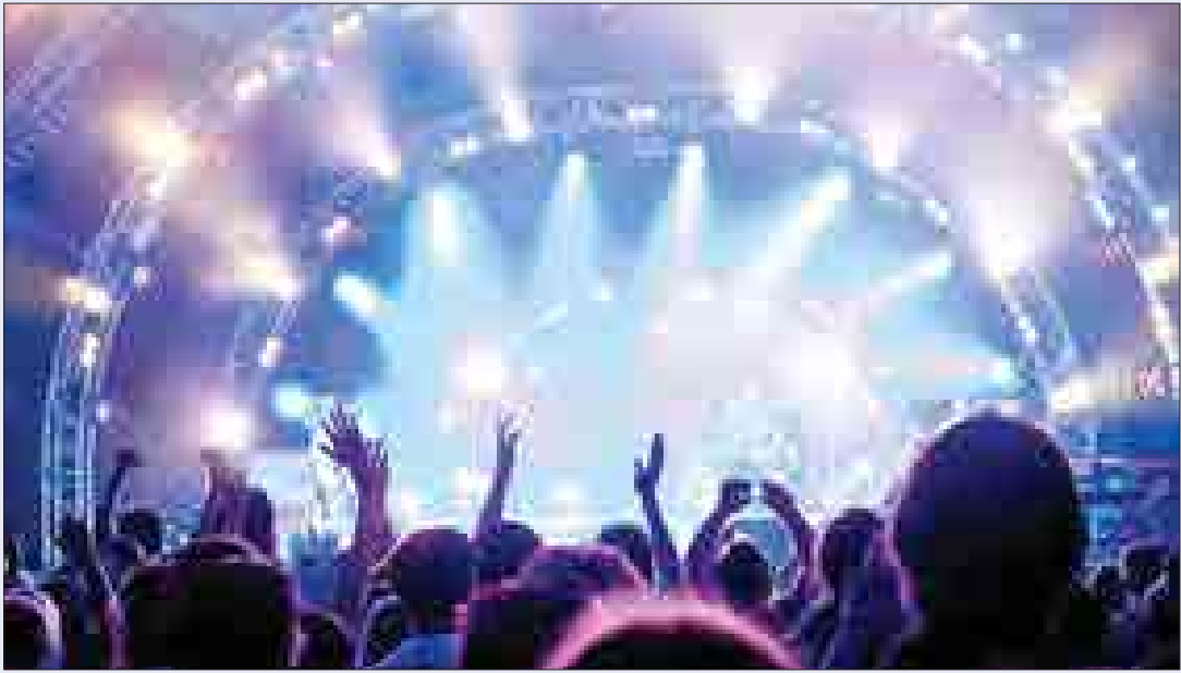
« حسین پارسا

پیام می‌آید ده دوازده سال پیش که فضای شهر ما کمی با امروز فرق داشت، خیر رسید که رضا صادقی یک شب در همدان کنسرت خواهد داشت. شور و شوقی که بنا این خیر در مردم افتاد، باورکردنی نبود. این هیجان نه فقط به دلیل حضور رضا صادقی بود، که البته محبوب بود و خوب می‌خواند، بلکه بیشتر به دلیل وقوع یک اتفاق کم سابقه در همدان بود. برای ساکنان شهرهای بزرگتر، دیدن هفتگی تبلیغ کنسرت های خوانندگان مختلف از همه سبک، چیز عجیبی نبود ولی برای همدانی ها چیرا. آن روزها همه جوان ها درباره کنسرت حرف می زدند و بزرگترها از قیمت بلیط می پرسیدند. آن اتفاق البته ادامه پیدا نکرد و تا چند سال بعد به کلی قطع شد. به نظر می رسید موزیک پاپ محبوب مسئولان و تصمیم گیرندگان همدانی نیست و علاقه ای به رواج آن در شهر ندارند. اگر هم کنسرتی برگزار می شد، مختص به گروه های سنتی بود که بعضی متوسط و بعضی هم خوب بودند.