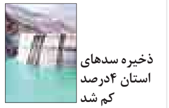
ذخیره سدهای استان ۴ درصد کم شد