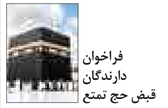
فراخوان دارندگان قبض حج تمتع