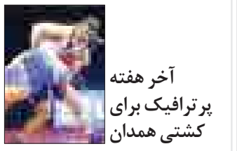
آخر هفته پرتراфик برای کشتی همدان