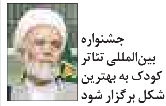
جشنواره بین‌المللی تئاتر کودک به بهترین شکل برگزار شود