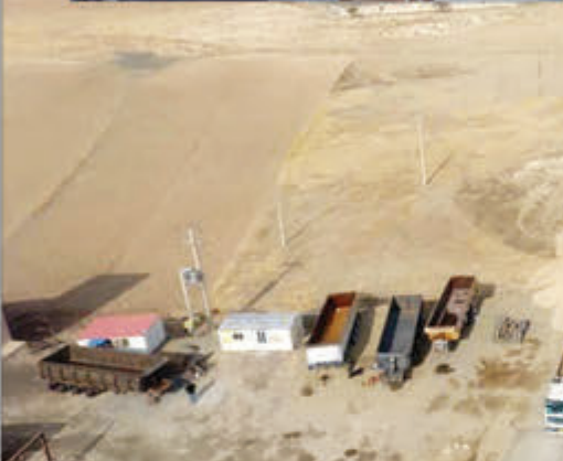
در این تصویر هنوز جاده همدان - سنندج احداث نشده بود و تردد مردم از راه قدیم و راه بختار و راه قدیم زاغه بوده است.