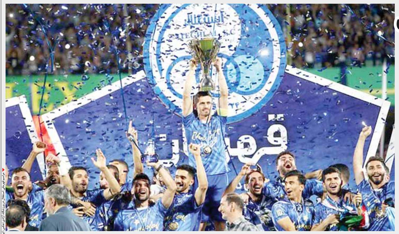
رسانه‌های استقلال در ورزشگاه آزادی جشن می‌گیرند

جشن قهرمانی تیم فوتبال استقلال پس از آخرین دیدار این تیم در بیست و یکمین دوره رقابت‌های لیگ برتر با حضور حدود ۹۰ هزار تماشاگر در ورزشگاه بزرگ آزادی تهران برگزار شد. استقلال با کسب ۶۸ امتیاز از رکورد پرسپولیس در کسب بیشترین امتیاز عبور کرد. سرخپوشان که نایب قهرمان لیگ شدند پیش از این با کسب ۶۷ امتیاز قهرمان شده بودند. همچنین سیدحسین حسینی با ۱۸ بازی بدون گل خورده توانست