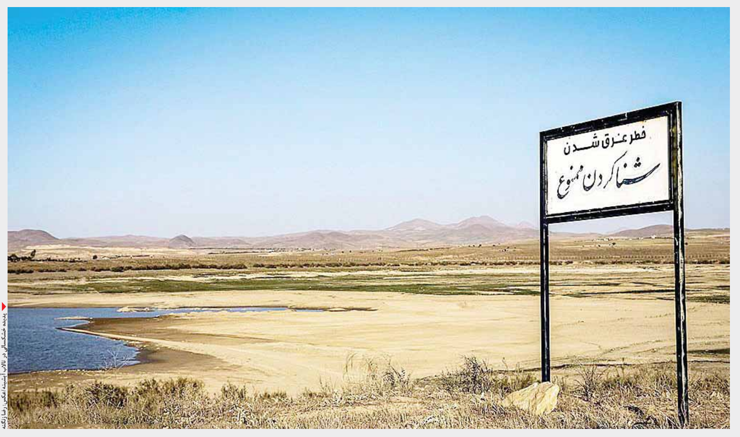
خشکسالی در استان همدان.