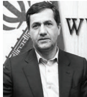
ادامه خبر صفحه ۴

خدابخشی در تشریح نشست کمیسیون برنامه و بودجه؛ رفع ایرادات طرح اصلاح ساختار بودجه درباره نحوه توزیع اعتبارات استانی