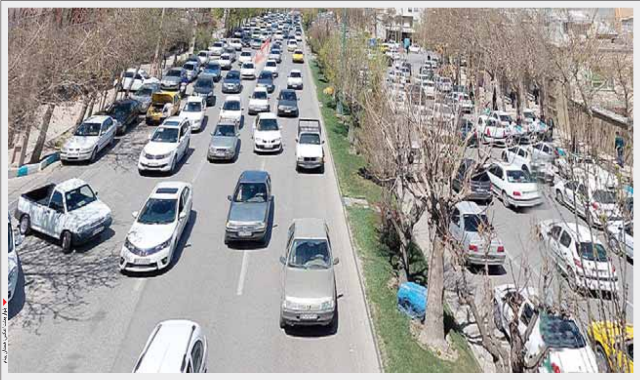
تنگناهای ترافیکی در مهاباد