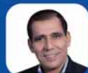
حسرو طالبی رحیق