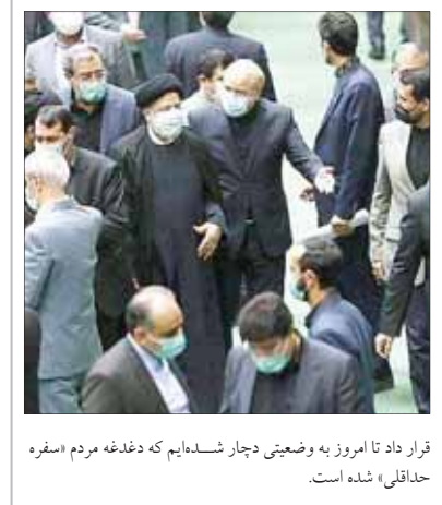
قرار داد تا امروز به وضعیتی دچار شده‌ایم که دغدغه مردم «سفره حداقلی» شده است.

همه این اتفاقات در حالی است که یوسف نوری، وزیر آموزش و پرورش در ۲۶ بهمن ماه درباره مسمومیت ادامه‌دار دانش‌آموزان در قم و تهران در واکنش گفت: بخش اعظم این مشکل ناشی از شایعاتی است که مردم و دانش‌آموزان را دچار ترس کرده است. از مراجع ذی‌صلاح گزارش گرفتیم و گفتند مشکلی وجود ندارد. اما در چهارشنبه هفته گذشته و با شدت یافتن مسأله، نوری از پیگیری این موضوع توسط وزارت کشور خبر داد. احمد وحیدی وزیر کشور نیز ۱۰ اسفند در جمع خبرنگاران در این باره گفت: تاکنون کسی درباره مسمومیت‌ها دستگیر نشده است و اگر چنانچه در این زمینه اطلاعاتی به دست بیاید مطرح می‌شود. همچنین بنا به دستور وزارت کشور و وزارت