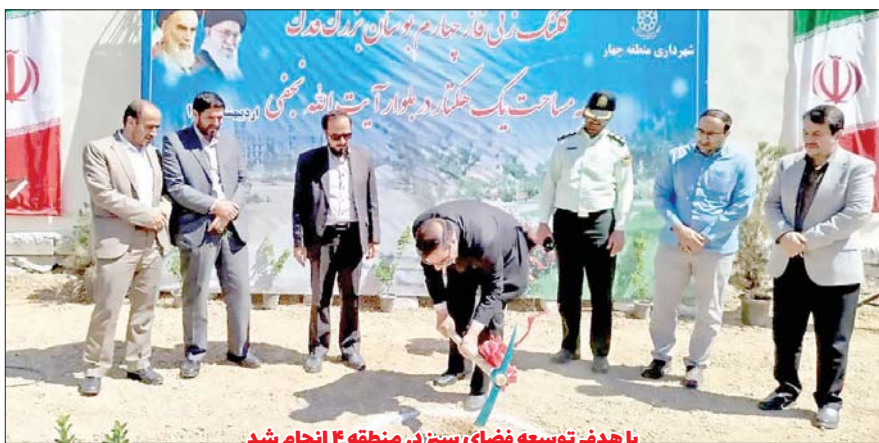
با هدف توسعه فضای سبز در منطقه ۴ انجام شد