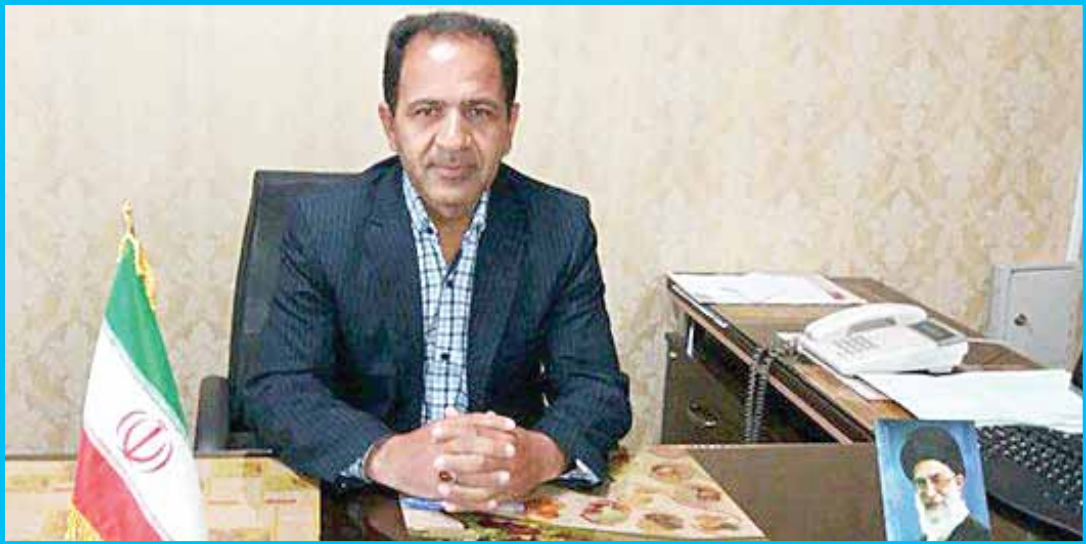
مدیر جهاد کشاورزی رزن مطرح کرد

فتحی اظهار کرد: به‌منظور جلوگیری از خام‌فروشی محصولات کشاورزی و افزایش درآمد کشاورزان، ایجاد صنایع تبدیلی و انبارهای نگهداری محصولات کشاورزی در برنامه‌های کار سازمان جهاد کشاورزی بوده و در جهت ساخت و توسعه این واحدها از آنها حمایت می‌کند. درحال حاضر در شهرستان‌های رزن و درگزین ۸ واحد سردخانه بالای صفر با ظرفیت بیشتر از ۶۰ هزار تن به بهره‌برداری رسیده و ۶ سردخانه با ظرفیت ۴۰ هزار تن درحال ساخت است.