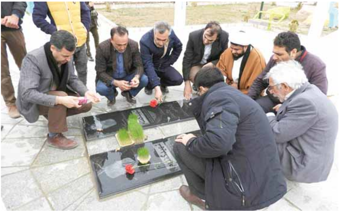
رئیس شورای اسلامی شهر دماق خبر داد