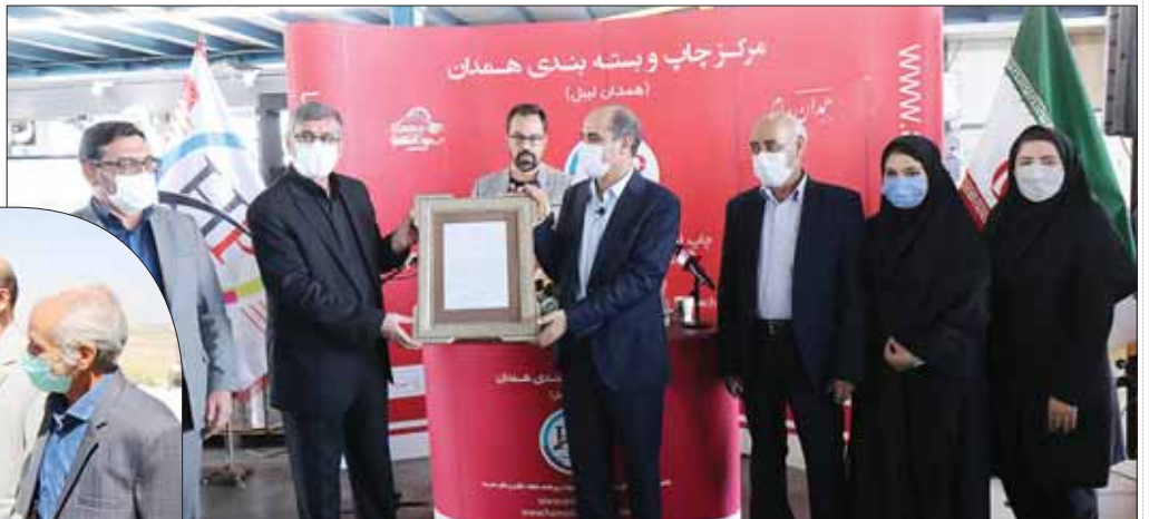
استاندار با اهدای لوح تقدیر، از مجموعه پیام‌رسانه به دلیل ۱۷سال خدمات فرهنگی و اقتصادی در راستای توسعه استان همدان، تقدیر کرد.

■ صحبت از فرهنگ همدان بدون نام بردن از همدان پیام امکان‌پذیر نیست ■ مدیرمسئول همدان پیام: برنامه توسعه سازمان اشتغالزایی برای ۲۰۰۰ نفر است