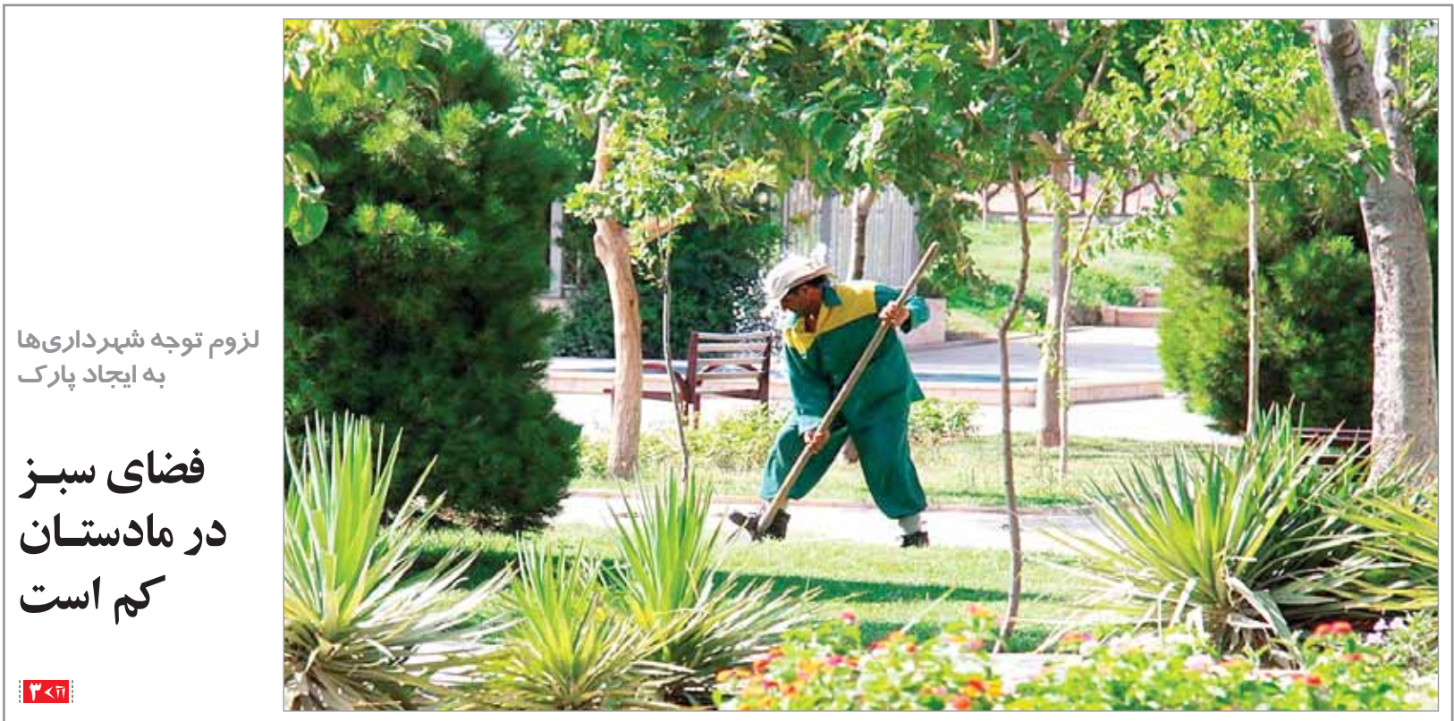
لزوم توجه شهرداری‌ها به ایجاد پارک