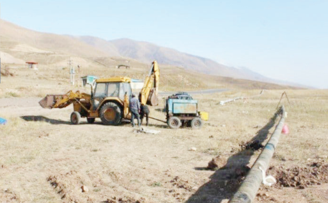
مدیرعامل شرکت گاز لرستان:

افزاینده‌های‌ها تا پایان امسال از نعمت گاز بهره‌مند می‌شوند