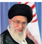
مقام معظم رهبری:

آن چه که از مطبوعات یک جامعه مسورد انتظار است، این است که معلومات مردم را بالا ببرند.