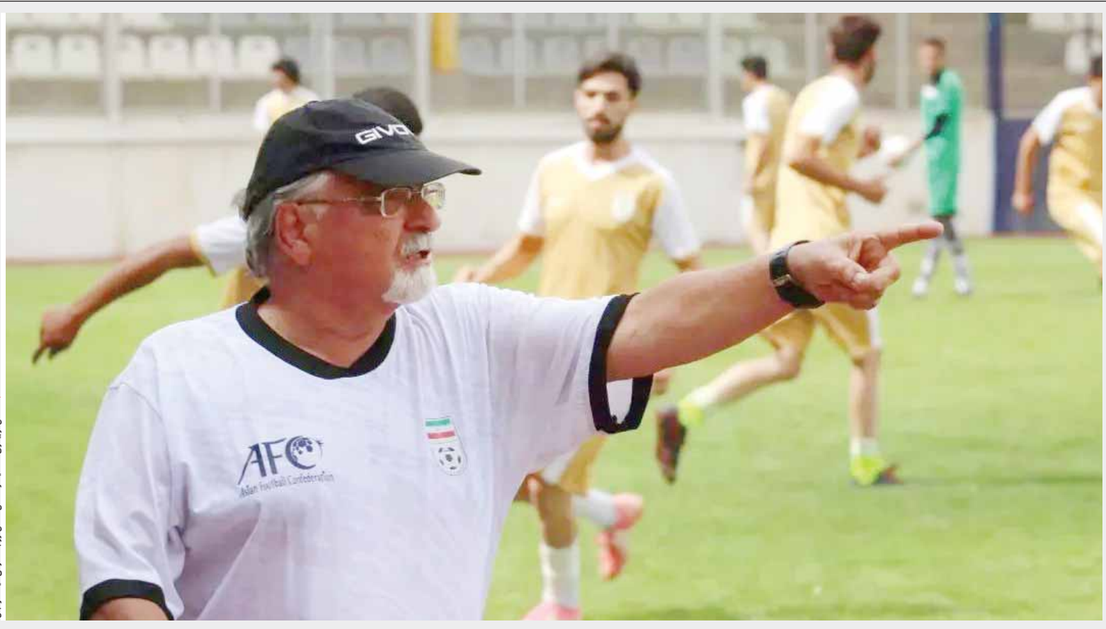
▲ کلاس مربگری، استاد همدان سخنرانی با موضوع فوتبال

این روزها در همدان شاهد برگزاری کلاس مربگری A آسیا زیر نظر مسعود اقبالی مدرس بین المللی کنفدراسیون فوتبال آسیا هستیم. مدرس بین المللی کنفدراسیون فوتبال آسیا و مدرس دوره مربگری فوتبال درجه A آسیا به میزبانان همدان عنوان کرد: «بازت دوم دوره مربگری فوتبال درجه A آسیا به پایان رسیده است. ۲۴ نفر در کلاس شرکت کرده اند که تعداد بیشتری آنها بومی استان همدان هستند. اکثر مربیان شرکت کننده در کلاس، در سطوح مختلف مشغول به فعالیت هستند. این دوره مربگری تا به اینجای کار بسیار خوب پیش رفته و امیدوارم تمامی شرکت کننده ها در