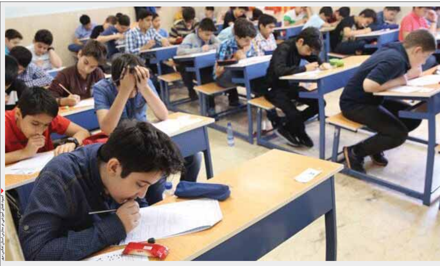
کمبود فضای آموزشی در مدارس استان مشخص است