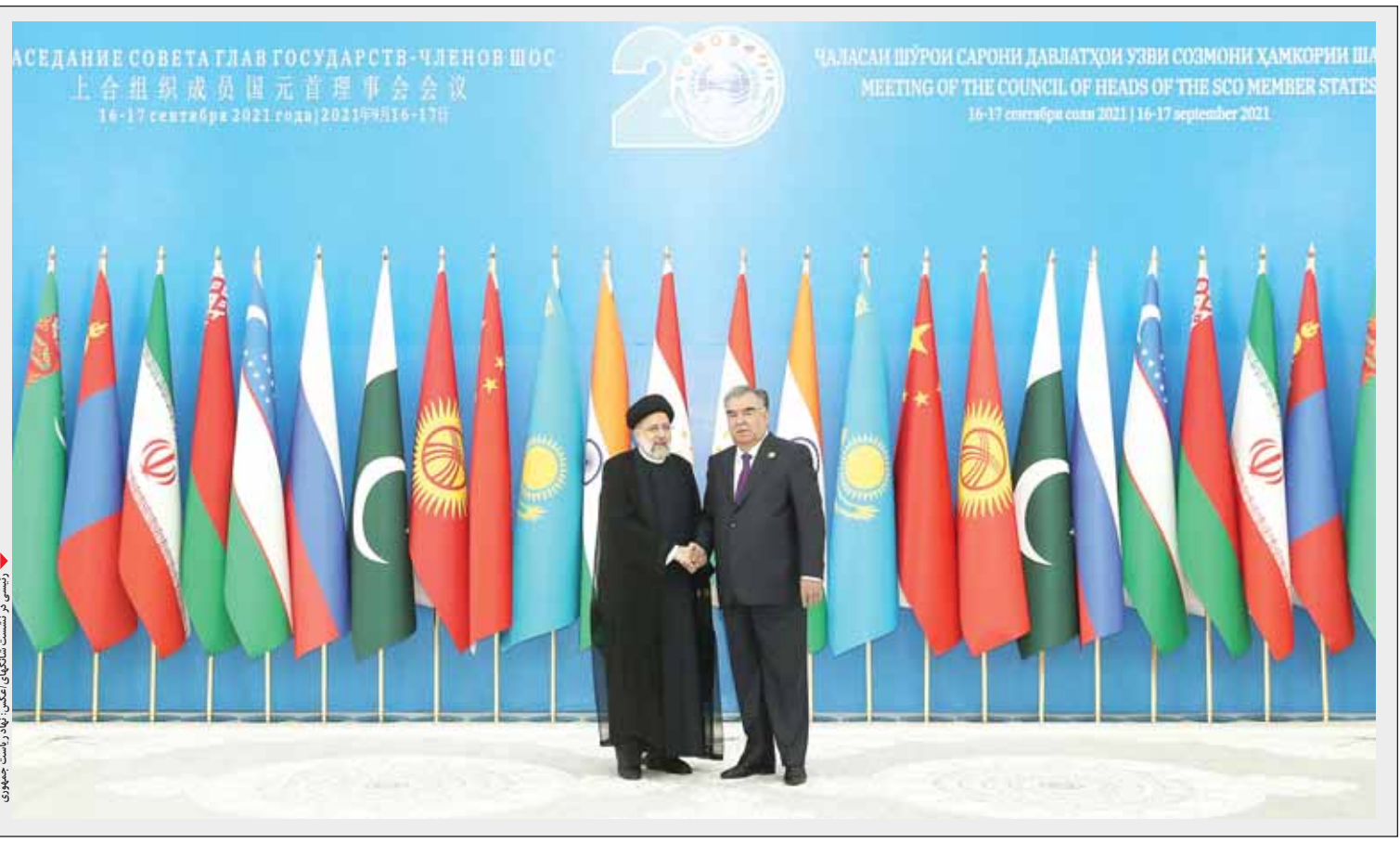
رئیس‌جمهور ایران با سران سازمان همکاری شانگهای