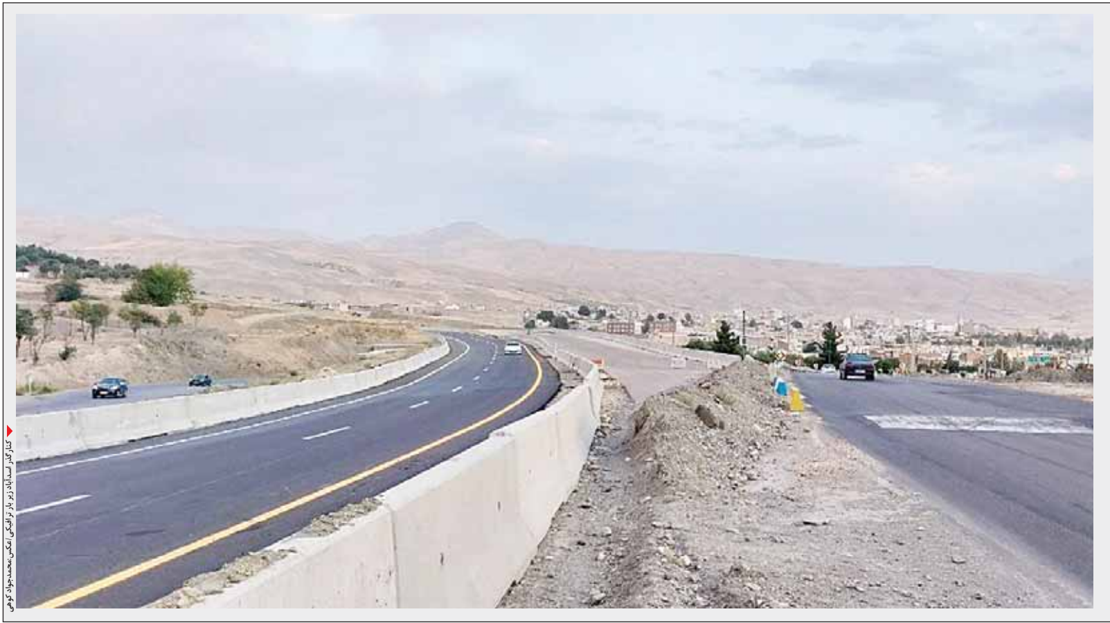
کنار گذر اسدآباد در روستای شیلاندر

▪ مردم روستای شیلاندر: تردد برای اهالی روستا های مجاور کنار گذر سخت شده است