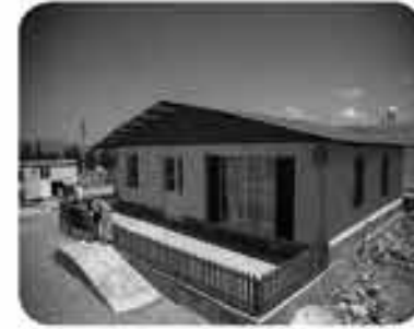
رییس بنیاد مسکن روستایی سرپل ذهاب

شهرستان سرپل ذهاب با ۲ بخش مرکزی و قلعه شاهین و حدود ۹۰ هزار تن جمعیت، دارای ۲۰۴ روستا است.