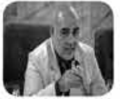
ایرنا - محمد ابراهیم الهی تبار در نخستین جلسه شورای اطلاع رسانی استان در سال جاری با اشاره به تغییر

ساختار شوراهای اطلاع رسانی بر توانمندی روابط عمومی ها و ارزیابی مدیران در ارتباط گیری با رسانه ها تاکید کرد. شورای اطلاع رسانی استان کرمانشاه امروز با ساختار جدید به ریاست الهی تبار معاون سیاسی، امنیتی و اجتماعی استاندار کرمانشاه تشکیل جلسه داد.