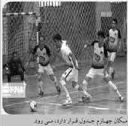
مکان چهارم جدول قرار دارد، می رود

مسابقات آب های آرام دومین المپیاد استعداد های برتر دختران کشور با حضور ۶۴ ورزشکار از ۱۸ استان کشور به میزبانی دریاچه شورابیل اردبیل برگزار شد. استان های البرز، قزوین، کرمانشاه، گیلان، سیستان و بلوچستان، بوشهر، تهران، تویب تهران، هرمزگان، یزد، کردستان، آذربایجان شرقی، آذربایجان غربی، همدان، لرستان، اردبیل، مازندران و خوزستان در این المپیاد حاضر بودند.