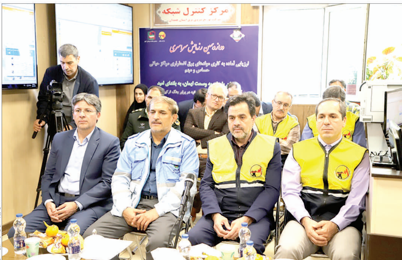
تکثیر روایت عمومی شرکت توزیع نیروی برق

رزمایش قطع برق و ارزیابی آماده به کاری مولدهای برق اضطراری در ۱۳ مرکز حیاتی، حساس و مهم استان همدان برگزار شد. مدیرعامل شرکت توزیع نیروی برق استان همدان در دوازدهمین رزمایش سراسری قطع برق و ارزیابی آماده به کاری مولدهای برق اضطراری مراکز حیاتی، حساس و مهم که به صورت همزمان با سراسر کشور در استان همدان برگزار شد، ضمن گرامی‌داشت هفته پدافند غیرعامل اظهار کرد: با توجه به اینکه در اثر بروز وقایع ناخواسته ممکن است شبکه تأمین برق قطع یا مختل شود، برگزاری این رزمایش‌ها و حفظ آمادگی برای شرایط اضطراری و یا بحرانی از اهمیت ویژه‌ای برخوردار است.