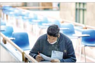
مشاوران و مدیران روابط عمومی سازمان سنجش آموزش کشور در ثبت نام بیش از ۲۸۰ هزار نفر برای نوبت دوم آزمون سراسری سال ۱۴۰۲

مهندسین و مدیران روابط عمومی سازمان سنجش آموزش کشور در ثبت نام بیش از ۲۸۰ هزار نفر برای نوبت دوم آزمون سراسری سال ۱۴۰۲