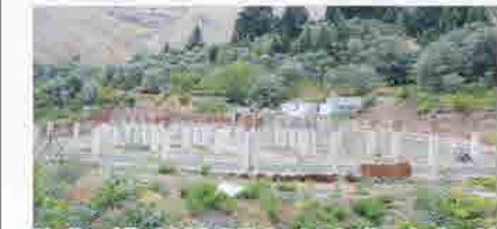
صفا مرکز توانبخشی و نگهداری سالمندان حضرت ابوالفضل (ع) شماره ۲ (در حال ساخت)

همچنین این مرکز آماده همکاری با خانواده ها در زمینه آموزش سالمندی، خدمات پزشکی، فیزیوتراپی، پرستاری، روانشناسی و در اختیار قرار دادن تخت، تشک مواج، واکر، اکسیژن، ویلچر و عصا برای سالمند عزیزتان در شهرهای رودبار، رستم آباد، لوشان، منجیل، جیرنده، بره سر، توتکابن و سایر مناطق روستایی می باشد.