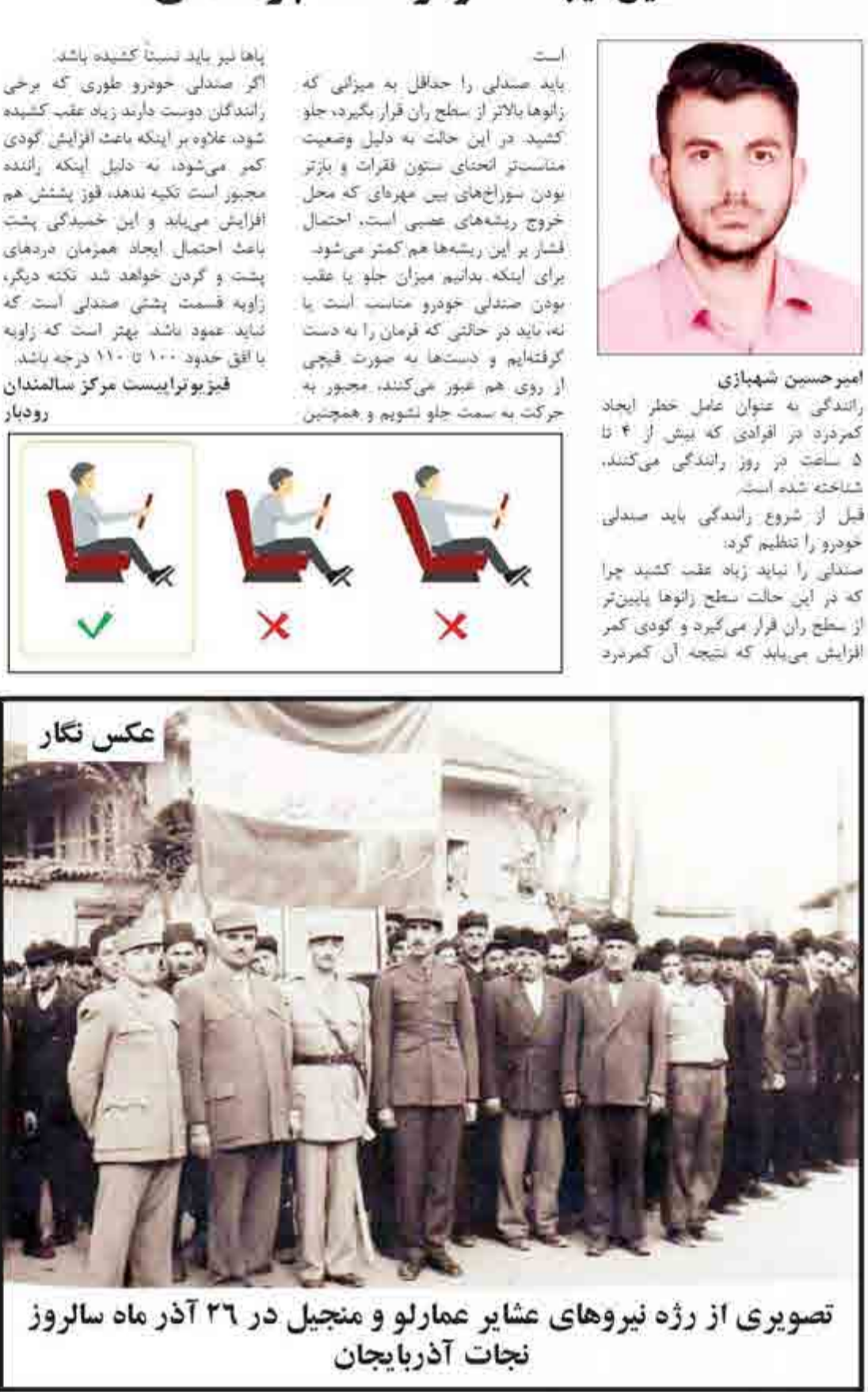
تصویری از رژه نیروهای عشایر عمارلو و منجیل در ۲۶ آذر ماه سالروز نجات آذربایجان