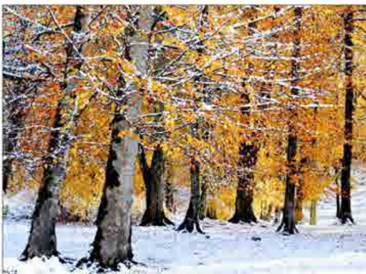
دو فصل در یک قاب - سیدشت

بنا به درخواست برخی از عکاسان شهرستان رودبار و جمعی از خولندگان همیشه همراه هفته نامه شکوفه های زیتون، از شماره ۸۲۹ قصد داریم با اختصاص قسمتی از این نشریه به انجمن عکاسان شهرستان رودبار ستون را به «عکس هفته» اختصاص دهیم. عکاسان و علاقمندان به عکاسی می توانند تصاویر خود را جهت بررسی و انتخاب انجمن عکاسان برای چاپ در شکوفه های زیتون به شماره واتسآپ (۰۹۱۱۳۳۶۹۶۰) فرزین احمدی ارسال نمایند. گفتنی است تصاویری که در این قسمت به چاپ می رسد توسط انجمن عکاسان شهرستان رودبار انتخاب می گردد و هیأت تحریریه شکوفه های زیتون در آن نقشی ندارد.