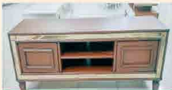
مدل های ست و جدید، میز آل سی دی و کنسول