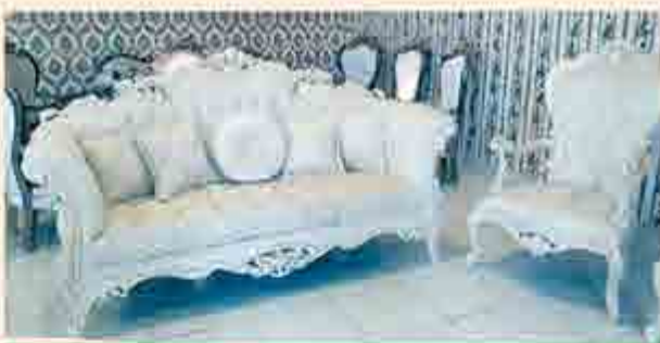
طراحی چشم نواز و مدرن مبلمان