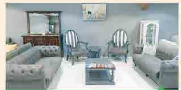
تولید و پخش انواع مبلمان راحتی با بهترین متریال

MOBLEMAN_PAYTAKHT • ۱۳ @MOBLEMAN_PAYTAKHT • ۱۳ ۰۹۱۹۶۰۱۶۲۲۴-۰۹۳۵۸۸۰۵۴۸۴