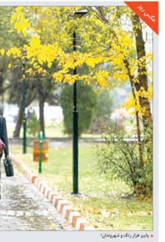
بازار زرنگار و شهردارستان