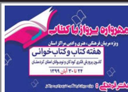
فراخوان مهرواره پرواز با کتاب در کردستان منتشر شد