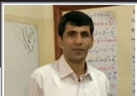
مادرها معلم‌اند اگر آموزش کافی ببینند