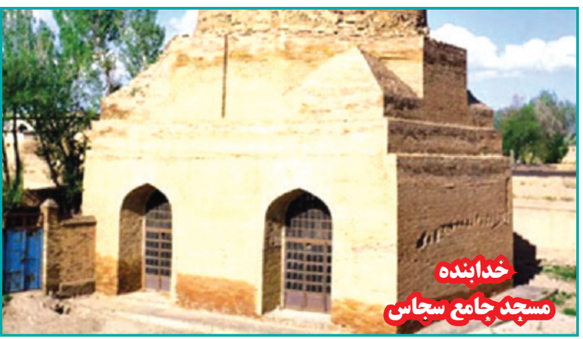
خداینده مسجد جامع سجاس