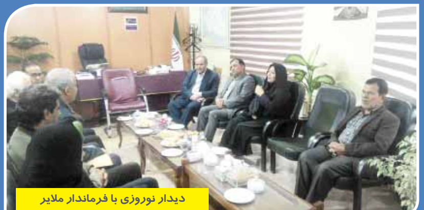
دیدار نوروزی با فرماندار ملایر