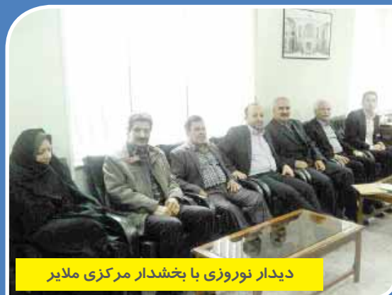
دیدار نوروزی با بخشدار مرکزی ملایر