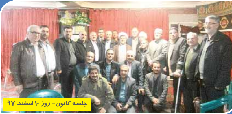
جلسه کانون - روز ۱۰ اسفند ۹۷