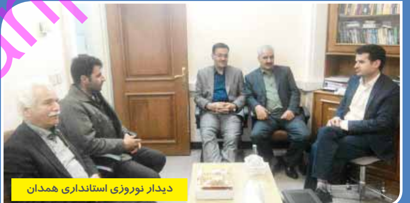
دیدار نوروزی استانداری همدان