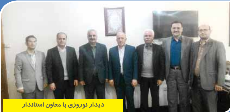
دیدار نوروزی با معاون استاندار