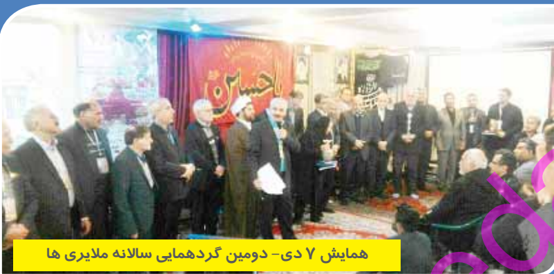
همایش ۷ دی - دومین گردهمایی سالانه ملایری ها