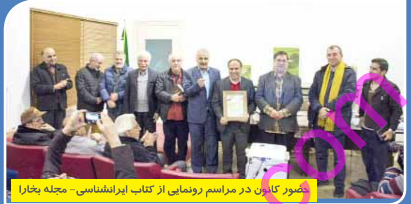
حضور کانون در مراسم رونمایی از کتاب ایرانشناسی - مجله بخارا