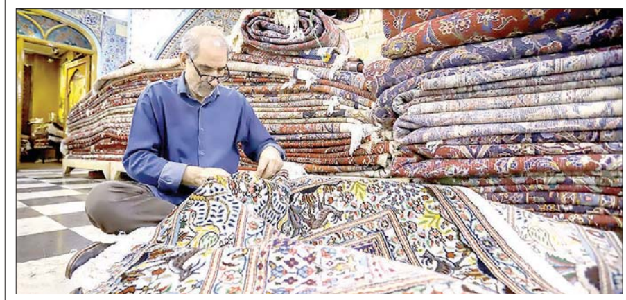
خانه فرش همدان فراموش نشد