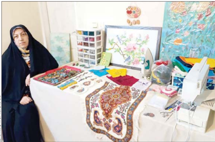
هنرمند هنر پاره حجابی