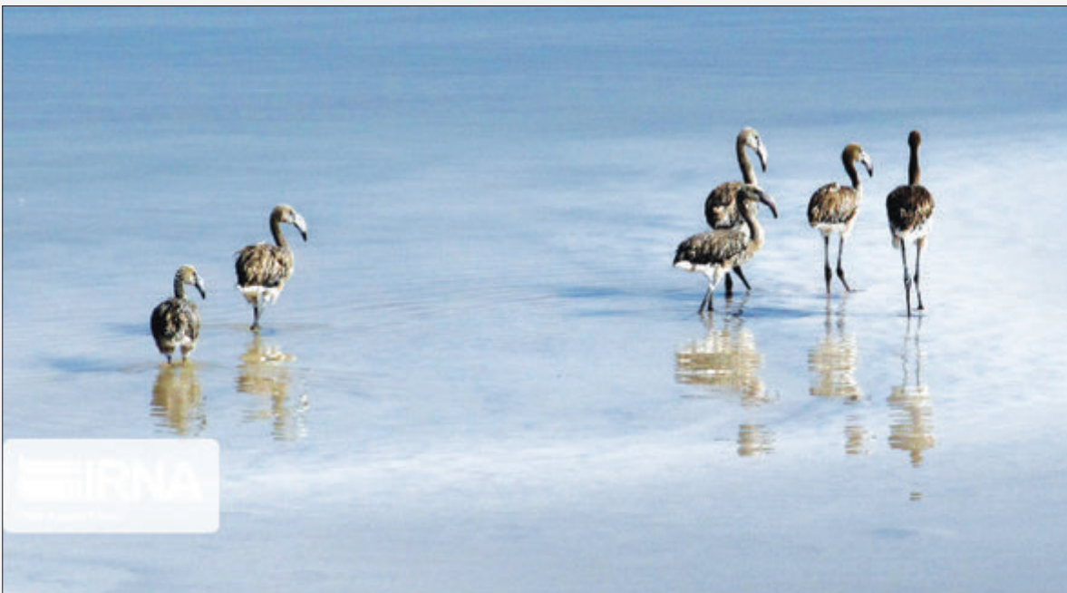
شهرستان های ماهنشان و طارم، است زمستان گذرانی می‌کنند.

رییس نظارت بر امور حیات وحش اداره کل حفاظت محیط زیست استان زنجان گفت: زیستگاه‌های پرندگان آبی و کنارآبی این استان، به دقت از سوی محیط بانان این اداره کل رصد و پایش می‌شود که هم اکنون عاری از هرگونه بیماری آنفلوانزا پرندگان (آنفلوآنزای مرغی) است.