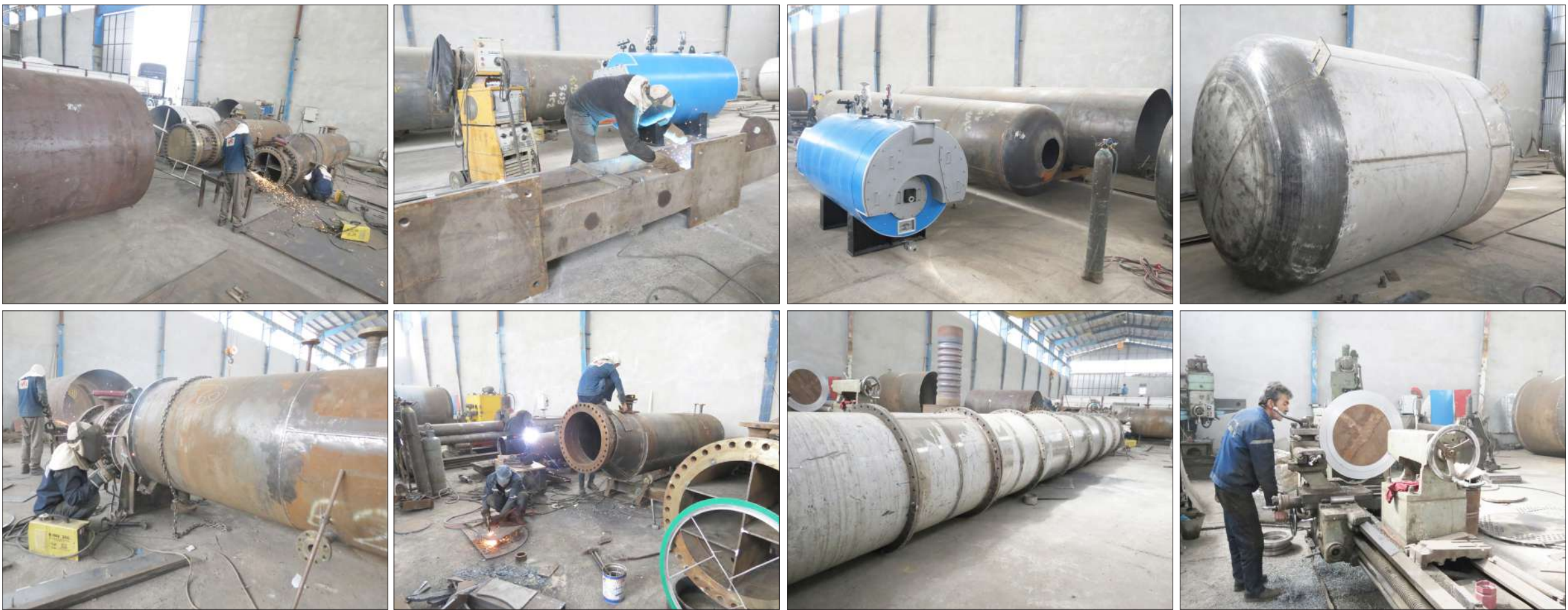
فیدار نوین آستانه

رئیس هیئت مدیره شرکت فیدار نوین آستانه گفت: شرکت شهرک های صنعتی به کارخانجات