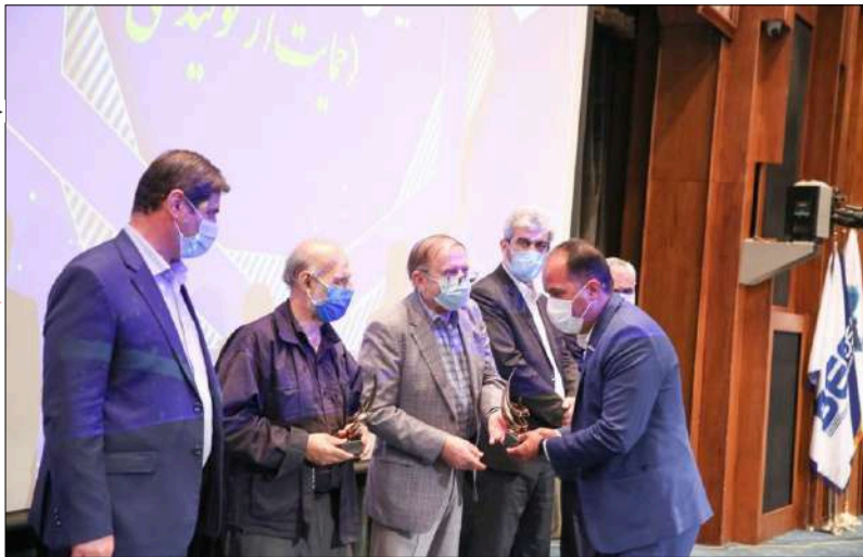
توسعه تولیدات صنعتی پلیمرسازان دلیجان

گروه کارخانجات صنعتی پلیمرسازان دلیجان تنها تولید کننده گرانول های مورد استفاده کارخانجات الیاف و نساجی ایران