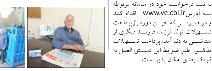
تسهیلات مورد نیاز کارخانجات صنعتی