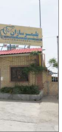
توسعه تولیدات صنعتی پلیمرسازان دلیجان