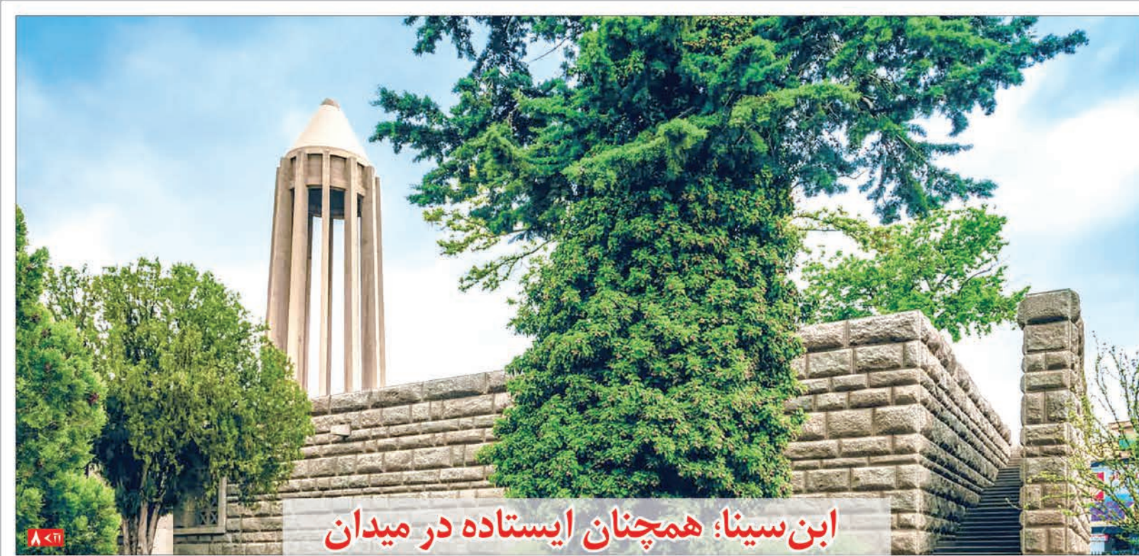
ابن سینا؛ همچنان ایستاده در میدان

در نشست تخصصی کتابخوان «هگمتانه تاریخی، همدان جهانی» مطرح شد؛