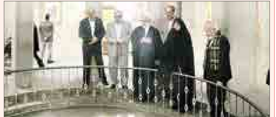
عشق را اساس عرفان می دانست.