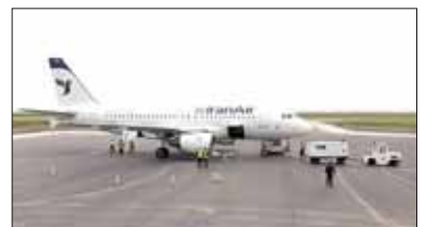
فرودگاه همدان هنوز پرواز ندارد