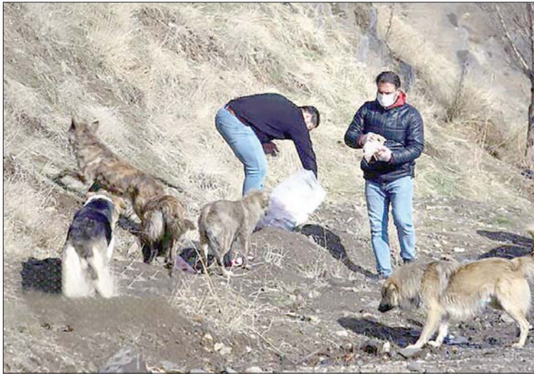
۱۱. واکیستاسیون ۱۵ هزار سگ در همدان