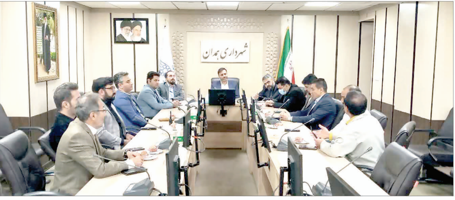
شهردار همدان بیان کرد