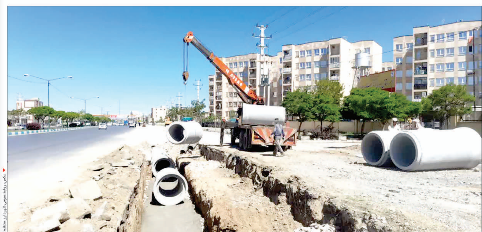
مدیر منطقه ۳ همدان خبر داد

هزینه ده میلیارد تومانی جهت جمع آوری و هدایت آبهای سطحی در سال ۱۴۰۲