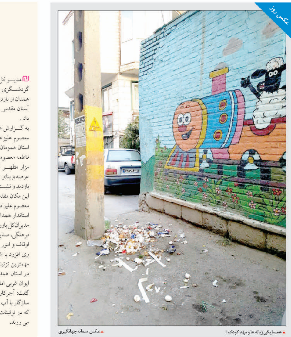
مسایگی زیاده ها و مهد کودک؟