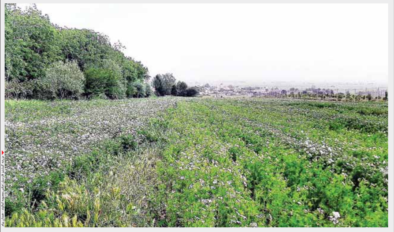
بزرگترین تولیدکننده گشنیز در شهرستان همدان پیام