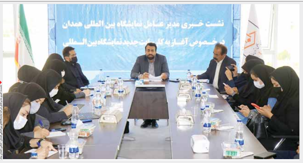
نشست خبری مدیرعامل نمایشگاه بین‌المللی همدان در خصوص آغاز به کار سایت جدید نمایشگاه بین‌المللی

سر نوشت تکراری مرگ پلاسکو بی بار در آبادان متروپل فرو ریخت یاد می‌شود دچار حادثه شد و بعد از ۳/۵ ساعت آتش سوزی فرو ریخت. در این حادثه ۳۳ نفر مصدوم شدند و تعداد زیادی از آتش نشانیان که برای نجات افراد داخل مجتمع اعزام شده بودند به شهادت رسیدند. در همین راستا نیز فیلم سینمایی چهارراه استانبول ساخته شد که روایتگر آن چیزی است که در پلاسکو ۱۲۰۰ واحدی رخ داد. روز گذشته حدودی اظهار نظر ساختمان ۱۰ طبقه اداری- تجاری متروپل در آبادان فرو ریخت تا سر نوشت تکراری پلاسکو اینبار در آبادان رخ دهد. سخنگوی اورژانس کشور همان ساعات ابتدایی حادثه از تلفات جانی این اتفاق خبر داد و گفت که برای انتقال مصدومان از شهرستان های خرمشهر، اهواز، شادگان و ماهشهر کمک و امدادسانی صورت گرفته