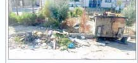
مناشی از اسما آباد

وضعیت پاک زیاده واقع در کوچه مرادی در شهرستان اسما آباد