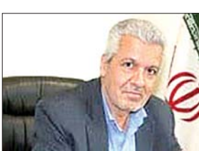
فرمانده زندان همدان در جریان بازدید از زندان

سندرسیت زندان‌های استان که به منظور بررسی پروژه‌های در دست اجرا و سرکشی از بخش‌های مختلف زندان همدان، این سفر به سر می‌برد و ابتدای روزه در زندان از تبادل احداث آسپناکه جدید پرسنل وظیفه بازدید کرد.