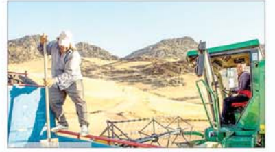
مطالبات گندمکاران همدان پرداخت شد