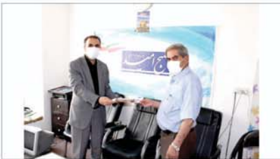
در میزبانان بستری است که روزنامه همدان پیام برای این پیشگفتار آرزوی بهبودی و سلامتی دارند.

مدیرکل راه و شهرسازی استان همدان از اجرای ۲۰ کیلومتر از پروژه چهارخانه توسیرکان به تکاور خبر داد و گفت تا دو هفته آینده بخش زیادی از قطعات ساختمانی می شود و زیر بار ترافیک ورودی. مدیرعامل شرکت شهرک های صنعتی استان همدان تأکید کرد که باید برنامه آماهی داشته باشند. همچنین، مدیرعامل شرکت شهرک های صنعتی استان همدان تأکید کرد که باید برنامه آماهی داشته باشند.