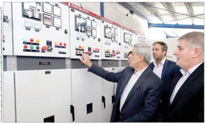
فرماندهای نیروگاه همدان در حال بازدید از اتاق کنترل