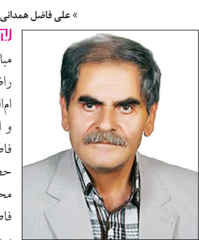
« علی فاضل همدانی

فاطمه ، زهره‌ا، طاهره، محله‌سه، بتسول، مبارک‌سه، محله‌سه، از القاب و راضیه و مرضیه از القاب و ام‌الحسن، ام‌الحسین، ائمه فاطمه(س) دخت گرامی حضرت ختمی مرتبت محمدابن عبدالله(ص) است. فاطمه در لغت به معنای بریده است. بریده از بدعه‌دی‌ها، بریده از بدبینی‌ها، بریده از بدعفتی‌ها و بی‌ججایی‌ها و بریده از هر چه می‌تواند به ستون دین رسول خدا(ص) ضربه وارد کند و فاطمه بریده از هر ناسپاسی و بر حذر از بی‌حرمتی. زهره در لغت به معنی درخشان و درخشنده است و زمانی که در محراب عبادت می‌ایستاد نورش بر اهل خانه و فرشتگان آسمان می‌تابید. صدیقه به معنی راستگو، راست‌پندار و به کسی که به جز راستی از او نمی‌توان دید گفته می‌شود و طاهره، معنایی به پاک‌ی و پاکیزگی دارد، مبارکه نیز به معنی خیر و برکت و بتول به معنای دور از ناپاکی و راضیه به معنی قضا و قدر الهی و مرضیه به معنی رضایت خداوند جهان‌آفرین است.