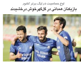
هفته بیست و سوم لیگ برتر فوتبال ایران با شکست پرسپولیس، پیروزی استقلال و گرم شدن رقابت در صدر جدول و گلزنی بازیکنان همدانی شافل در لیگ برتر دنبال شد.