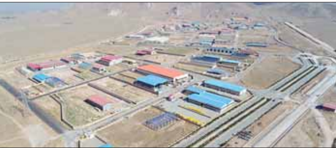
معاون صنایع کوچک شرکت شهرک‌های صنعتی:

مرجع مختلف کارگروه امور زیربنایی استان، شورای برنامه‌ریزی استان و کمیسیون ماده ۵ شورای عالی معماری و شهرسازی استان همدان مسیر به‌صورت هم‌سطح از منتهی‌علیه شرقی بلوار شهید همدانی با فاصله ۳۵۰ متر تصویب شد. این مقام مسئول با بیان اینکه پایان سال گذشته طراحی ساختمان ایستگاه درون‌شهری قطار به مشاور ابلاغ شد، مطرح کرد: کار نوآورانه‌ای برای طراحی این ایستگاه در نظر گرفته شده است، به‌طوری‌که مشاور باید علاوه بر طراحی ساختمان‌های ایستگاه بحث TOD (توسعه حمل‌ونقل محور) را در نظر بگیرد. نوروزی با تأکید بر اینکه بر پایه TOD شهر براساس سامانه‌های حمل و نقل توسعه می‌یابد، گفت: با مرکزیت ایستگاه اتوبوس و راه‌آهن در محدوده مسافت‌هایی که قابل دسترسی است، تمامی نیازمندی‌های یک مسافر عمر از نیازهای تجاری، تفریحی، اداری، خدماتی و فضای سبز دیده می‌شود که در شرح خدمات قرارداد مشاور در نظر گرفته شده است. وی اذعان کرد: قرار است مشاور در ۶ هکتاری که برای ایستگاه درون‌شهری قطار همدان دیده شده، این خدمات را در طرح‌ها در نظر بگیرد