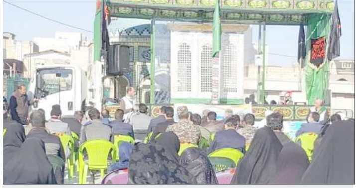
چانشین ستاد بازسازی عتبات عالیات استان مرکزی: ستاد بازسازی عتبات عالیات یادگار سردار دل‌ها شهید حاج قاسم سلیمانی است

عنوان یک اثر هنری و معنوی کم نظیر است، گفت: بحمدالله شور و دلدادگی مردم متدین و محب اهل بیت ایران اسلامی به ویژه مردم ولایت‌مدار استان مرکزی از زمان شروع ساخت نیم ضریح سرداب مقدس، صحنه‌های زیبایی را از مراتب عشق خود به اهل بیت خلق کرده‌اند که غیرقابل توصیف است.