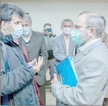
نخبگان آگاه هستند که اقتصاد کشور در چه وضعیتی از رشد اقتصادی، بلدی، بهره‌وری، تورم و نرخ سرمایه‌گذاری تحویل دولت جدید شد. استاندار مرکزی در بخش دیگری