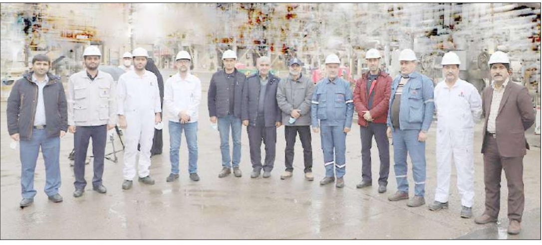
حساس مکاتباتی با شرکت های خارجی به عمل آمد که براساس روش پیشنهادی شرکت های خارجی الزام می‌بایست یونیت مژکور کاملاً تعطیل و راکتور از محل خارج شده و به کارگاه ساخت منتقل می‌گردد، این روش قطعاً موجب تحمیل هزینه‌های سنگین

سازای اراک به عنوان تنها شرکت صاحب صلاحیت داخلی برای اجرای این پروژه بسیار مهم و حساس، با تکیه بر تجارب علمی و عملی کارشناسان فنی و اجرایی خود و با اعتماد و همدلی کارفرمای محترم، برای اولین بار در ایران اسلامی، کلیه روش‌ها و اسناد تدوین و پس از اخذ تأییدیه فنی کارفرمای محترم، با رعایت بالاترین الزامات فنی و مهندسی و ایمنی بدون تعطیلی یونیت و بدون خارج نمودن راکتور از محل و در سخت‌ترین شرایط، تعمیرات با بالاترین کیفیت انجام شده و پس از تأییدیه سلامت تجهیز با تست‌های NDT و هیدرواستاتیک، راکتور وارد فاز بهره‌برداری شد. همچنین برای اولین بار در کشور عملیات ذوب ریزی و ساخت قطعاتی از پروژه همانند فلنج و تست بلوک‌های این راکتور با آلپاژ و الزامات خاص در شرکت ماشین سازی اراک انجام شد.