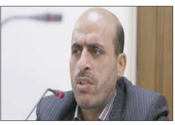
کشاوری از وزیر محترم کشاورزی خواستار پاسخگویی شدم که ایشان با حضور در کمیسیون مربوطه متعهد شد که دست واسطه‌ها

و دلان را از محصولات کشاورزی به ویژه کشمش، کوتاه کند. وی افزود: با توجه به اینکه اشتغال اصلی مردم خنداب، جاورسیان، میلجرود و کمیجان، کشاورزی و تولید انگور و کشمش است با پیگیری و مکاتبات انجام شده، تشکیل شورای عالی کشمش در وزارت جهاد کشاورزی هدفگذاری شد. نماینده مردم اراک، خنداب و کمیجان اظهار کرد: این اقدام با هدف تضمین حمایت از تولیدکنندگان کشمش در شهرستان‌های خنداب، کمیجان، ملایر و دیگر تاکستان‌ها، انجام شده است.