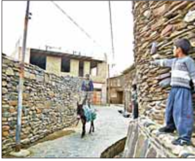
روستایی به اشتغال جوانان و توسعه منطقه‌ای و زمینه‌سازی برای مهاجرت معکوس به روستاها فراهم خواهد شد.

وی گفت: با اجرای این تفاهم‌نامه و احیا و بهره‌برداری از بناهای تاریخی و فرهنگی علاوه بر رونق گردشگری