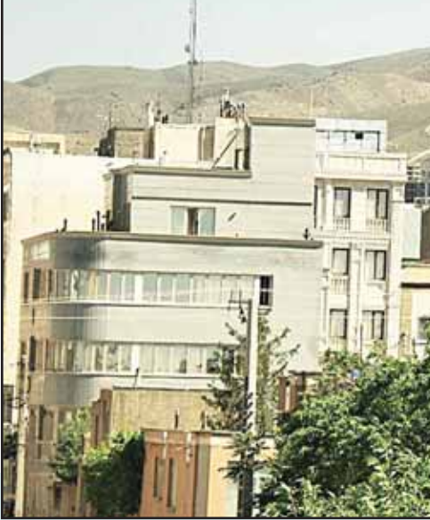
تکمیل ساختمان‌ها در ملایر

۱۱ سونامی افزایش قیمت مسکن، شهرستان‌های همدان را نیز درنوردیده و گرانی بسیاری را مردم را بی‌پناه کرده است. مسئولان سواره سرخوش نیز از حال پیاده‌ها بی‌خبرند. کمتر کسی از مدیران پیدا می‌شود که بدون مسکن باشد و هیچ مسئولی، بی‌سرپناهی دیگران و حال وخیم مستأجران را درک نکند! در این آشفته بازار مسکن و قیمت‌های سر به فلک کشیده، بیشتر صاحب‌خانه‌ها هم ساز خود را زده و بی‌هیچ ملاحظه‌ای اجاره‌بها را سرسام‌آور افزایش می‌دهند. اجاره‌نشینان نگوین‌بخت هم زیر دست و پای اسب لجام‌گسیخته بی‌مسئولیتی و بی‌کفایتی زمام‌داران له شده و در جهان کرونازده می‌خوانند.