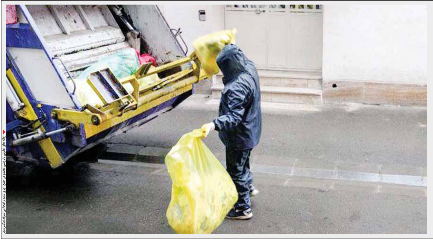
زباله‌های عفونی با رعایت اصول بهداشتی جمع‌آوری می‌شوند.

هزینه جمع آوری یک کیلو زباله عفونی ۱۲ هزار تومان است