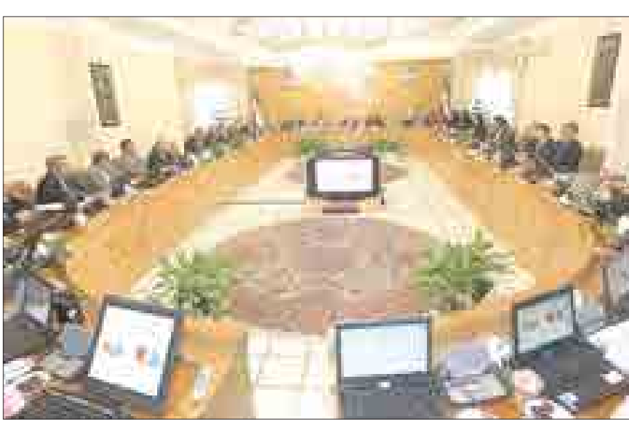
نمایانگر جلسه با مدیران شهرداری همدان

▪ مراقب اشتباه تاکتیکی در انتخاب جانشین مدیران باشید